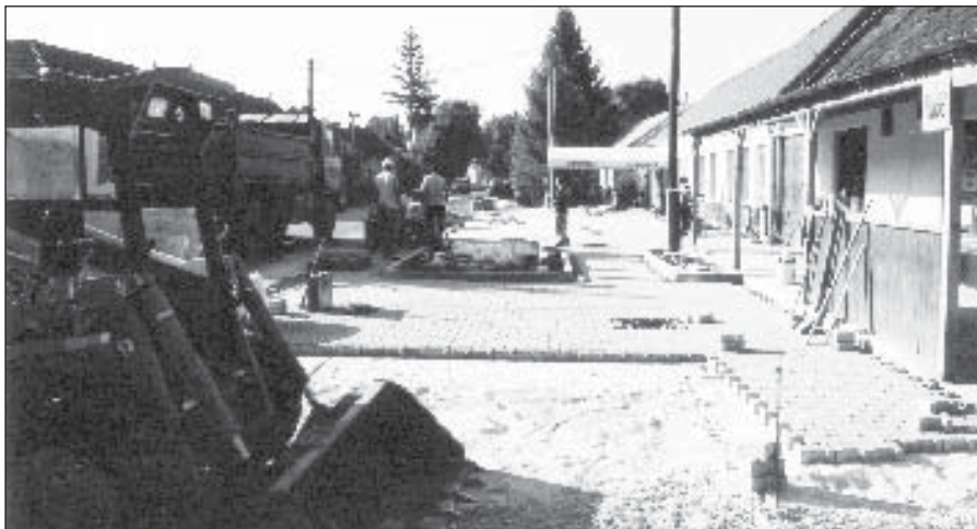
● Výstavba spevnených plôch na Ul. J. Hollého.