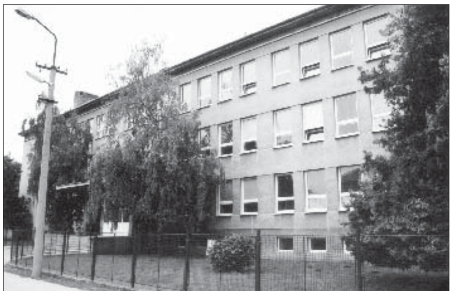
• Budova základnej školy sa dnes pýši novými oknami.

Súbežne s ostatnými prácami sa pokračovalo na výstavbe kanalizácie na Trnavskej ceste a na riešení prípojok. Veľmi dôležité bolo vyriešiť odkanalizovanie obidvoch školských zariadení, a to práve v čase prázdnin. Obidve prípojky boli veľmi komplikované. Odkanalizovanie materskej školy sa napokon vyriešilo prečerpávaním splaškov, nakoľko vyústenie kanalizácie z budovy sa nachádza v zadnej časti budovy a je nižšie ako úroveň domovej pripojovacej šachty. Odkanalizovať budovu