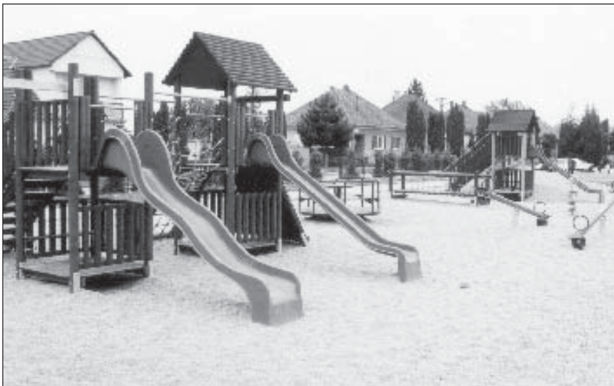
● Pohľad na novovybudované detské ihrisko.