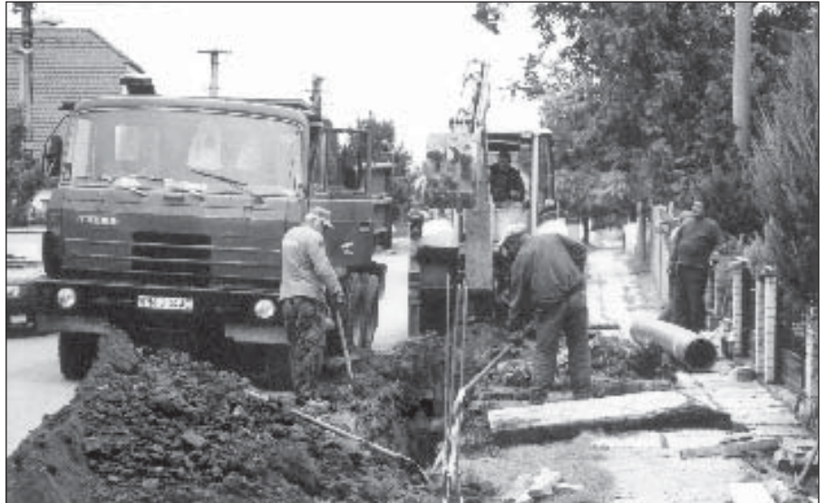
• Výstavba kanalizácie na Trnavskej ceste.

lované vnútorné horizontálne žalúzie. Steny, ktorých sa rekonštrukcia dotýkala, a tiež tie, na ktorých sa nedávno menili nové tabule, boli vymaľované a kompletne boli zrekonštruované aj vnútorné betónové parapety. Verím, že okrem dobrej vetrateľnosti tried a ostatných priestorov, budú nové okná aj ekonomickým prínosom. Okrem okien, bol