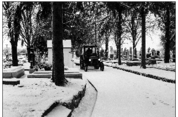
● Pracovníci Katelstavu sa starajú aj o zjazdnosť chodníkov na cintoríne.

Fakt, že peňazí niet, sa potvrdzuje aj pri predkladaní žiadostí o štátne dotácie na obnovu a rekonštrukciu obecných budov, verejného osvetlenia, výstavbu kanalizácie a pod. V minulom roku obdržala dotáciu z MŽP SR z celého Piešťanskeho okresu iba jedna obec, čo znamená, že výška nenávratných dotácií, ktoré štát poskytuje obciam, z roka na rok klesá. Zatiaľ budeme pracovať s financiami, ktoré získame z výnosu na daniach za pozemky a stavby od fyzických a právnických osôb v katastri Veľké Kostoľany. Žiaľ, bude