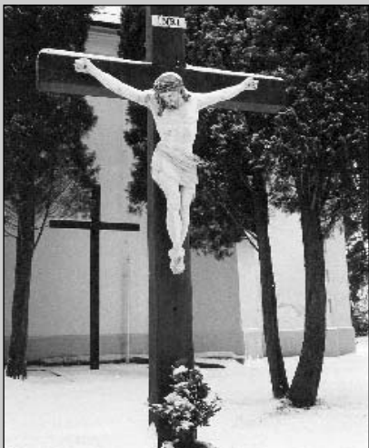
● Snímka kríža s Ukrižovaným pred kostolom pochádza z obdobia krátko pred jeho krádežou.

Dedinou sa nesie šum o človeku, ktorý takýmto bezcharakterným činom hlboko klesol v očiach občanov. Poľutovania hodný nerozvážlivec! (r)