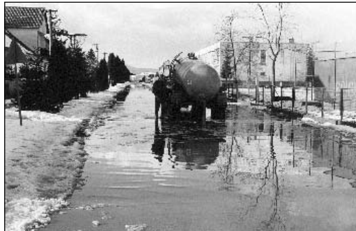
● Veľké snehové zrážky a následné oteplenie nám prinieslo do obce opäť veľa vody. Pohľad na Ulicu Ľudovíta Štúra.

zahŕňali takmer všetky priekopy. Existujúce vpusťe a odvodňovacie kanále už do veľkej miery nahladol zub času. Na niektorých úsekoch to bude možno problematické, ale postupne sa budeme snažiť aspoň čiastočne odvodniť obecné komunikácie. (gl)