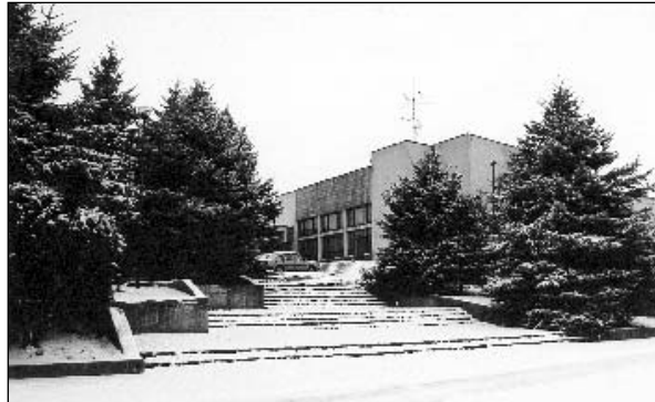
● Zasnežená krajina má vždy svoje čaro. Pohľad na kultúrny dom.

Vážení spoluobčania, nachádzame sa už v piatom roku nového tisícročia. Ktovie, aký bude? Možno nebude ničím výnimočný a možno bude pre nás úspešný. Skôr ako začneme plánovať nový rok, obzrieme sa trochu dozadu a zhodnotíme ten predchádzajúci. Každý občan vidí aktivity, ktoré sa v obci realizovali, inak, pre každého je prioritou niečo iné.