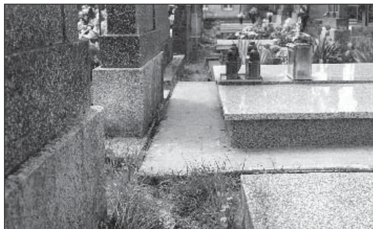
● Príklad zlého riešenia osadenia základov a chodníka na hrobovom mieste.

Už niekoľko rokov sa na cintoríne kradne. Okrem krhliel a kľučiek na bránach, sú každý rok odcudzené guľové ventily na vodovodnom potrubí. Z dôvodu rozmáhajúceho sa vanda-