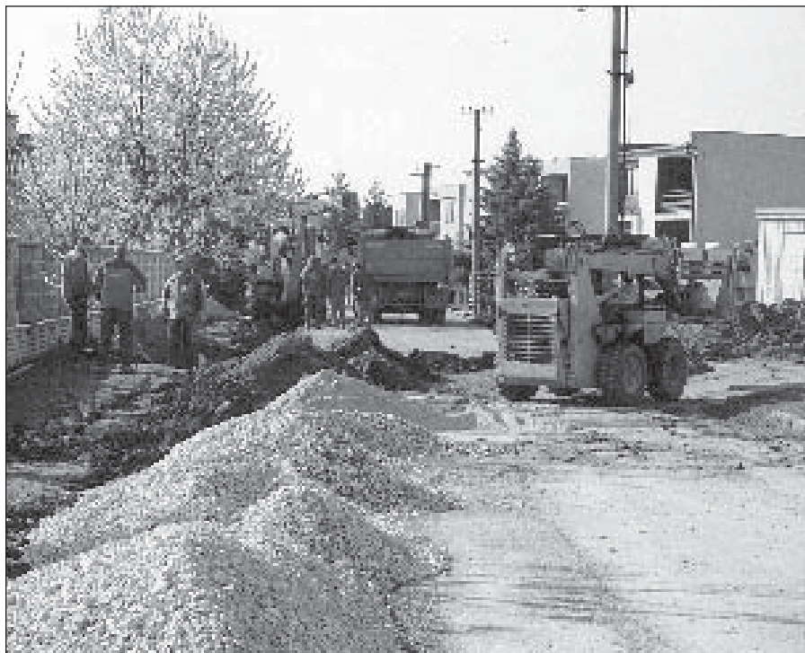
● Výstavba splaškovej kanalizácie na Ul. Petra Jilemnického.