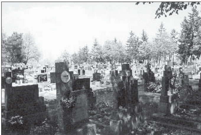
● Staršie pomníky na cintoríne sú osadené správne. Problémové sú však tie, ktoré boli osadené nedávno.

Tento článok je adresovaný všetkým, ktorí vykonávajú na cintoríne akékoľvek stavebné práce, či iné úpravy. Podľa všeobecne záväzného nariadenia (VZN) obce Veľké Kostolany o správe a prevádzkovaní cintorínov č. 3/1999 je obec správcom cintorína a všetky práce na cintoríne smú občania vykonávať len na základe súhlasu obecného úradu. Doteraz tak urobilo možno 5 percent všetkých občanov. Ostatní budovali „na čierno“ a proti nariadeniu platného VZN.