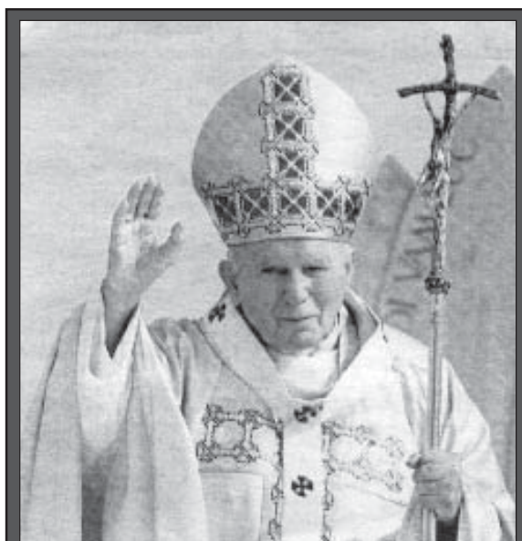
Pápež Ján Pavol II. 18.5.1920 – 2.4.2005 KAROL WOJTYŁA – Wadowice, Poľsko

Slovensko nosil v srdci, my si do srdca uložíme jeho dobrotu.