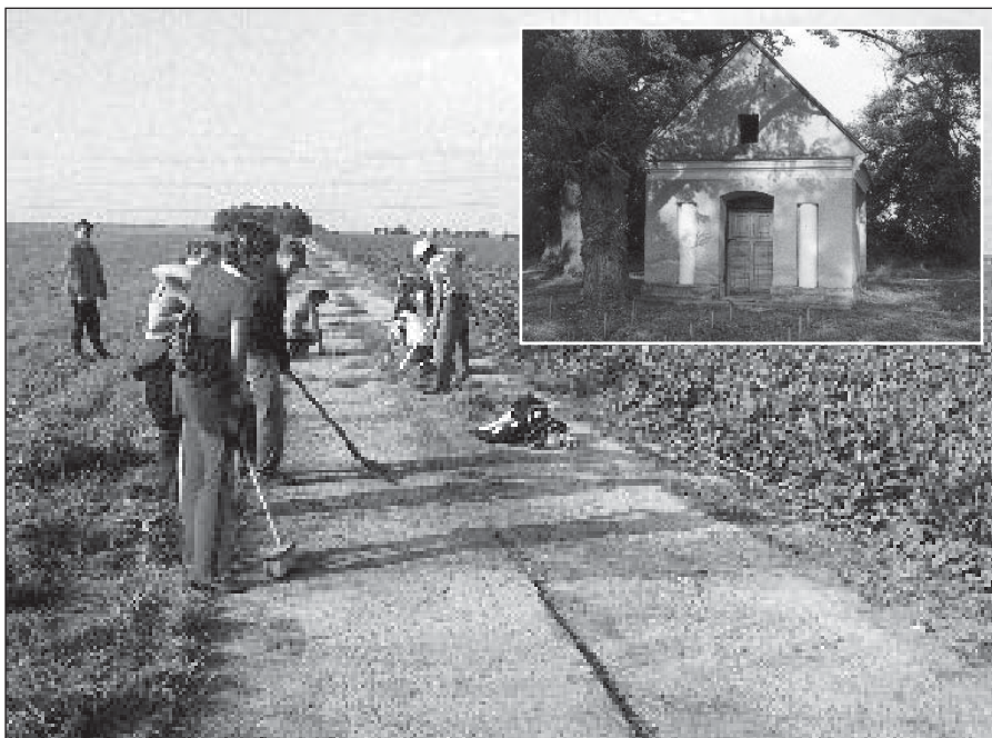
● Čistenie cesty pred púťou do Hájička. V hornom rohu hájska kaplnka.