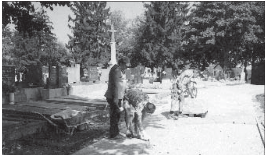
● Kladenie dlažby na cintoríne.