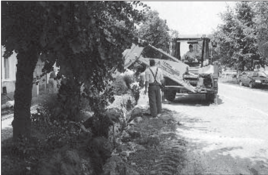
● Výstavba kanalizácie na Ulicí C. Majerníka.