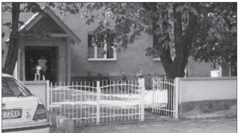
● Nová bránka do dvora zdravotného strediska.