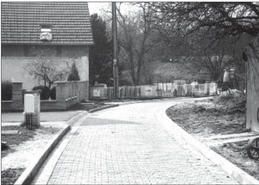
● Zrekonštruovaná ulica Pod sadmi.