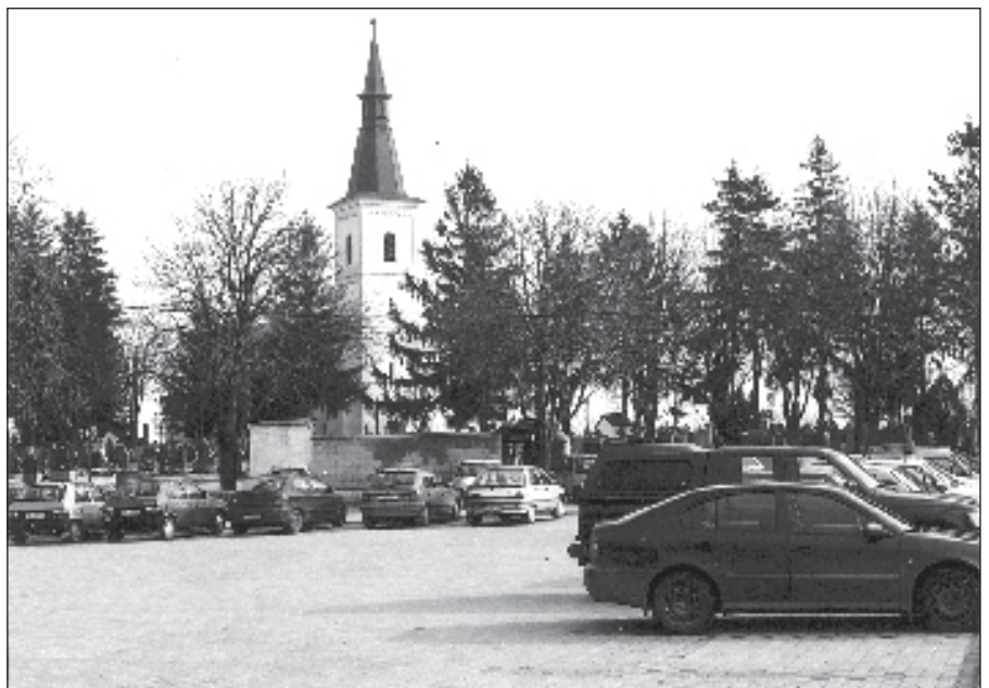
• Parkovisko pri cintoríne je počas cirkevných obradov naplno využité.