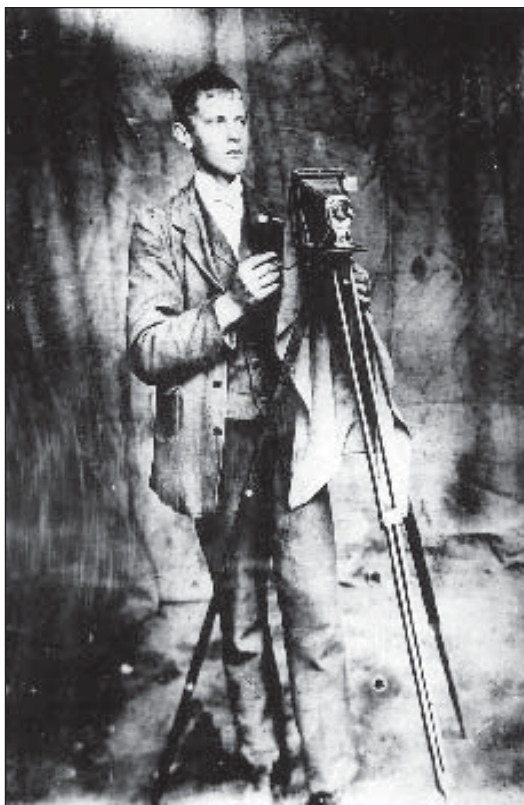
● Fotograf Peter Kolarovič.

- Asi v roku 1932, keď vedel, že fotografovanie ho neuziví, začal sa venovať „šenkárstvu“. Šenk, krčma, alebo správnejšie povedané pohostinstvo sa nachádzalo vedľa súčasnej budovy pošty. V tej budove, kde dnes sídli pošta, bola kedysi škola a neskôr banka – sporiteľňa.