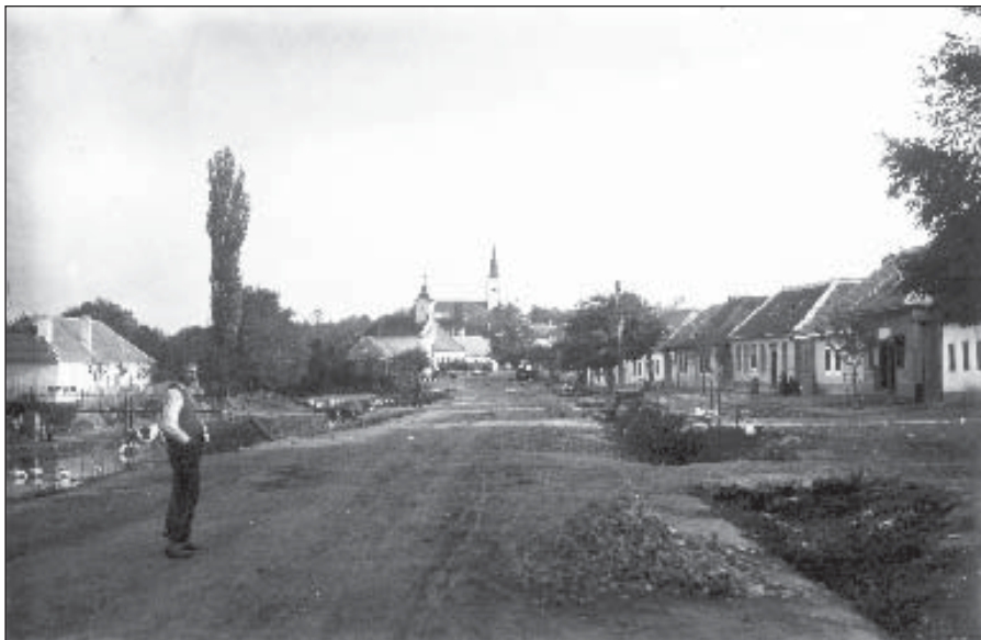
● Ulica C. Majerníka v prvej polovici 20. storočia.

a napriek svojmu zraneniu z vojny, nútený pracovať v baniach v Ostrave. Tam pracoval od roku 1958 až do roku 1963, kedy ako šesťdesiatročný odišiel do dôchodku. Ako dôchodca naďalej býval vo svojom dome s rodinou a v roku 1972 vo veku 79 rokov zomrel.