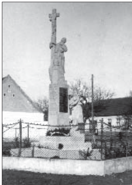
● Novopostavený pamätník padlým v I. svetovej vojne.

- Pred pár rokmi sme robili poriadky na povale rodičovského domu. Tam sme našli v drevených debniach množstvo sklenených tabuliek, na ktoré sa v minulosti fotilo. Okrem nich tam bol aj fotoaparát, s ktorým otec chodieval po dedine a dokumentoval. My ako obyčajní ľudia sme tomu nepripisovali nijakú vážnosť a tiež sme to nepovažovali za historickú hodnotu. Množstvo tabuliek sme nevedomky aj povyhádzovali. Tie, ktoré sa zachovali, dcéra neskôr ponúkla na burze starožitností v Krakovanoch. Tam sa pri nej zastavil aj súčasný riaditeľ Balneologického múzea, ktorého sklené tabuľky veľmi zaujali a vypýtal si telefonický kontakt na našu rodinu. Takmer po piatich rokoch sa múzeum rozhodlo požiadať nás o tabuľky a fotoaparát. Tak sme im ich bezplatne venovali. V decembri minulého roka múzeum zorganizovalo výstavu fotografií môjho otca pod názvom Šaty robia človeka, na otvorení ktorej som sa spolu so svojou sestrou a manželom zúčastnila. Bolo to veľmi pútavé a až tu som si uvedomila historickú hodnotu práce môjho otca. Som veľmi rada, že po niekoľkých desaťročiach uzreli svetlo