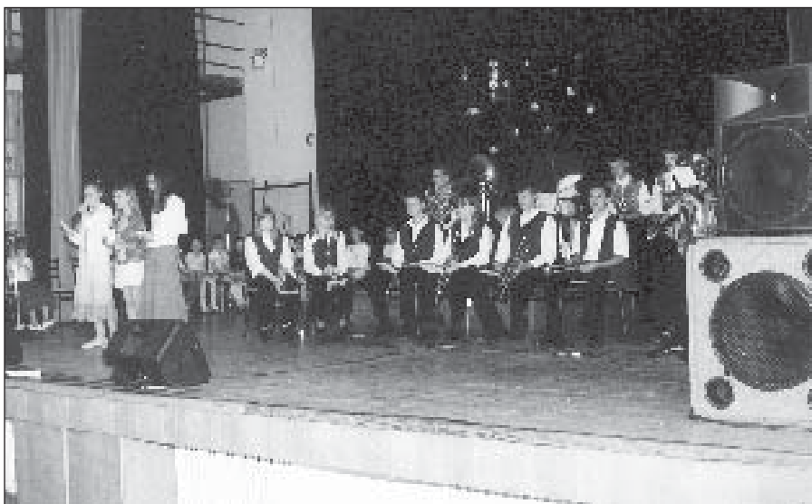
● Mladí speváci a dychovkári potešili svoje mamičky.