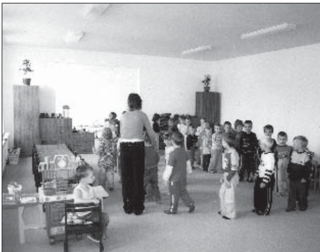
• Škôlkari v nových priestoroch materskej školy.