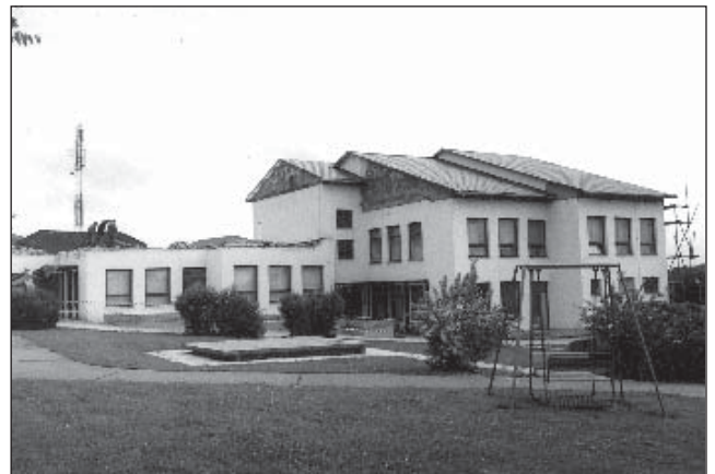
• Pohľad na budovu materskej školy. Časť budovy je už zastrešená, ďalšia časť je vo výstavbe.

- Posledný májový víkend bola premiestnená prevádzka tried „malákov a veľkáčov“