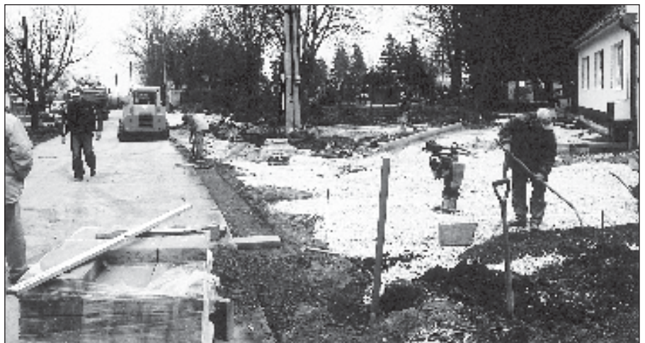
• Výstavba vstupu na cintorín zo Zákostolskej ulice.