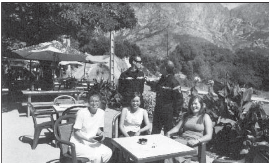
● Bocognano 2004