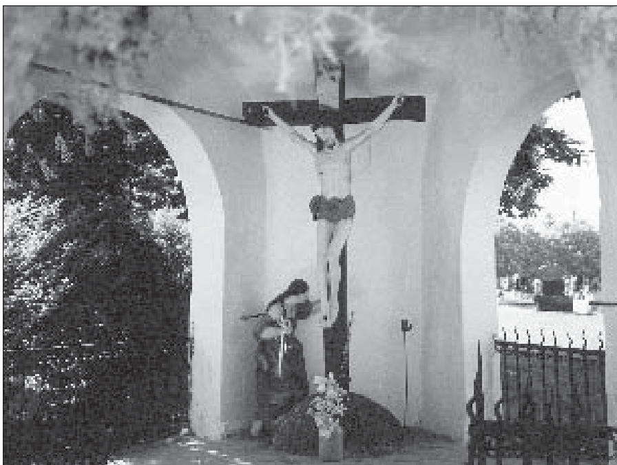
● Ukrižovaný Ježiš v trojhrannej kaplnke (misionárka kaplnka) vo Veľkých Kostol'anoch.