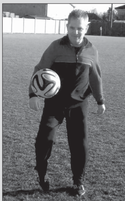
● Práve jubilant svojim gólom rozhodol o výsledku zápasu