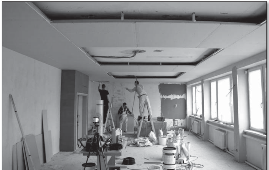
● Práce na rekonštrukcii malej zasadacej miestnosti

Podobným spôsobom sme zrealizovali aj veľkú zasadaciu miestnosť. Opadávajúca omietka na strope je už minulosťou a v nových priestoroch sa hostia budú cítiť oveľa príjemnejšie. Premiéru budú mať vynovené zasadačky už koncom apríla. Spolu s týmito rekonštrukciami sa vykonávajú aj práce na obnove sociálnych zariadení, ktoré už boli zastarané a splachovacie zariadenia často poruchové. Postupne by sme mali v budú-