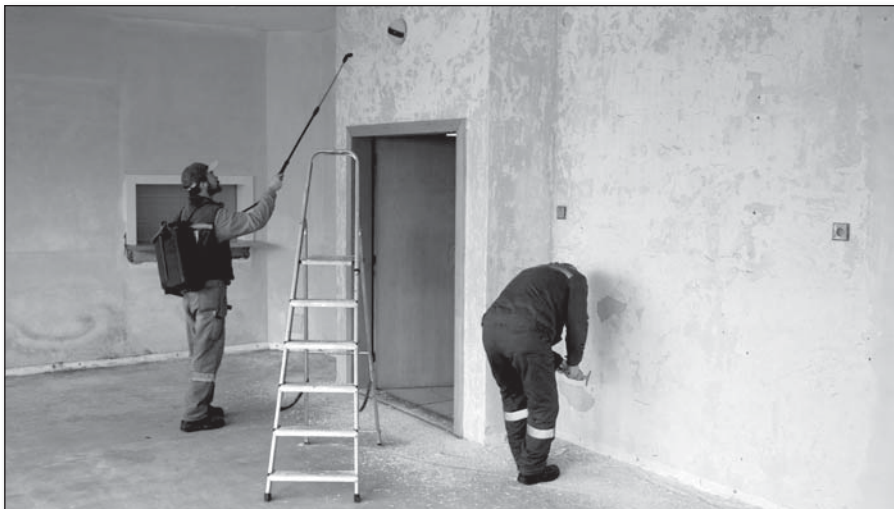
● Pred stierkovaním bolo potrebné zbaviť stenu niekoľkých vrstiev maľby

Taktiež podľa požiadavky občanov zo Zá-kostolskej ulice sa bude sanovať svah, ktorý ohrozuje miestnu komunikáciu a tiež bezpečnosť občanov. Pri privalových dažďoch hrozi jeho zosuv. Celú situáciu posúdil privolaný