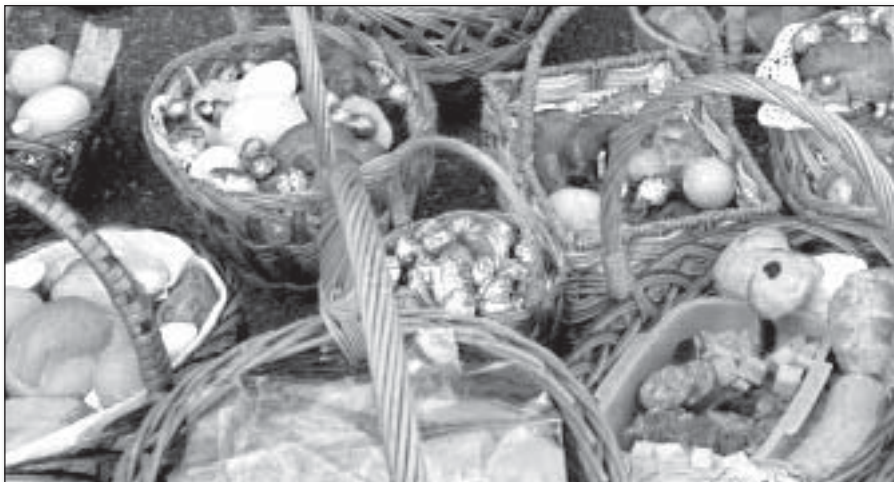
● V prinesených košíkoch uložené všetky druhy obradných veľkonočných jedál kňaz s veľkou dôstojnosťou posväť

Týždeň pred Veľkou nocou – Kvetná nedeľa – pripomína deň palmových ratoleťí, kedy ľudia nimi vítali Pána pri jeho vstupe do Jeruzalema (hlavného mesta Izraela) a takto mu vystieľali cestu. Palmové listy boli symbolom Kristovho víťazstva nad hriechom a smrťou. U nás ich nahradili bahniatka, rozkvitnuté ratoleťí vrby či rakyty, ktoré tiež signalizujú prebúdzajúci sa