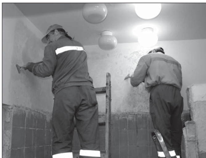
● Odstraňovanie starých obkladov a náterov vo WC