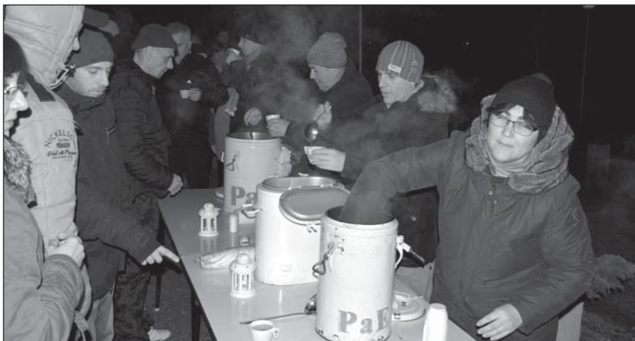
• Počas silvestrovského ohňostroja sa všetci zahrievali vareným vínkem alebo čajom