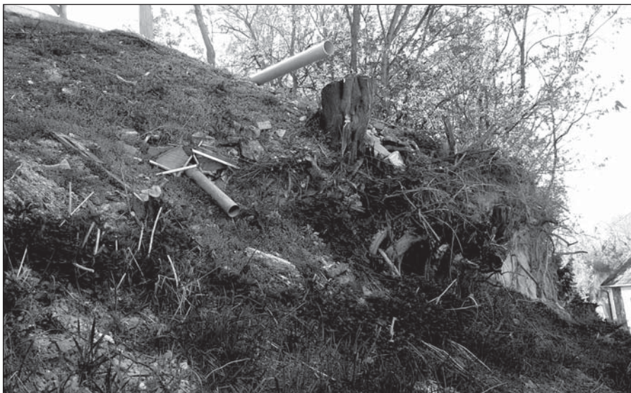
● Svah na Zá-kostolskej ulici je potrebné spevniť, erózia ho neustále narúša, čomu nepomáha ani vyvedenie dažďovej vody bez povolenia