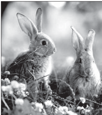
● V dnešnej rozšírenej európskej tradícii je zajačik označovaný za toho, kto počas Veľkej noci prináša vajíčka, najradšej čokoládové

život na začiatku jari. Bahniatka sú symbolom života. Bahniatka pripomínajú aj to, že tak ako sa ich kvet udrží po celý rok, tak aj náš život má charakterizovať stabilita a jednotnosť. Ratoleťí bahniatok posvätené na Kvetnú nedeľu sa považujú za ochranný štít pred zlom, chorobami a inými neudmami. Bahniatka v rôznych slovenských nárečiach, nech už im hovoríme baránky, babuliatka, či baburiatka, jahňady, birky či kozičky, súvisia s názvami mláďat rodiacich sa na jar. Ľudia si ich dávali do väzy a zastokávali za obrazy, aby dom chránili pred bleskom.