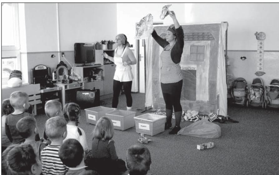
• Škola škriatkov – ako separovať