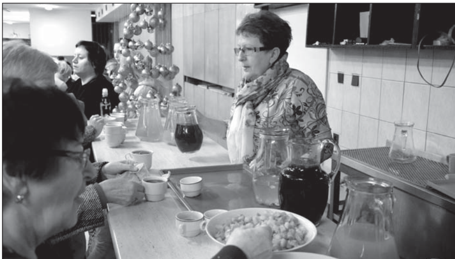
• Okrem koláčikov šiel na odbyt aj vynikajúci punč