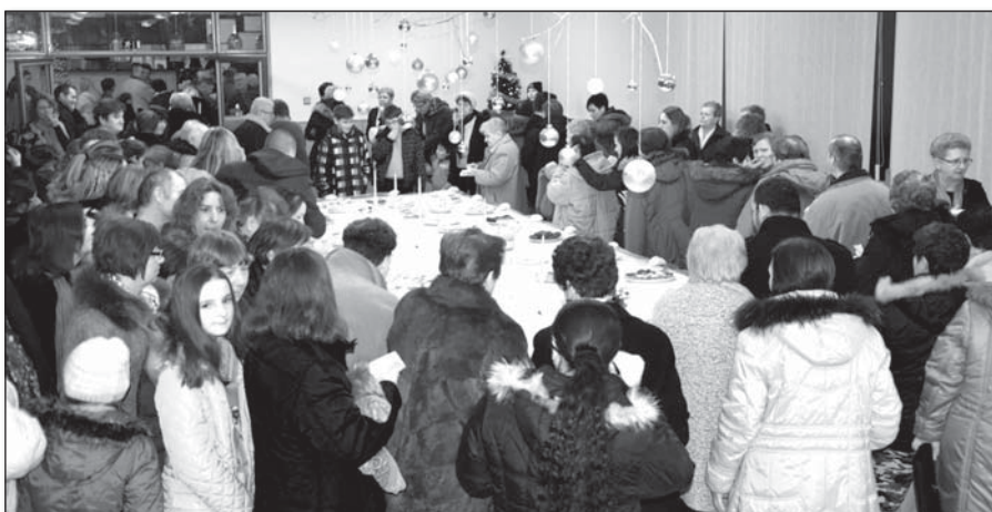
• Po koncerte sa diváci presunuli do zasadacej miestnosti, aby ochutnali z každej dobroty