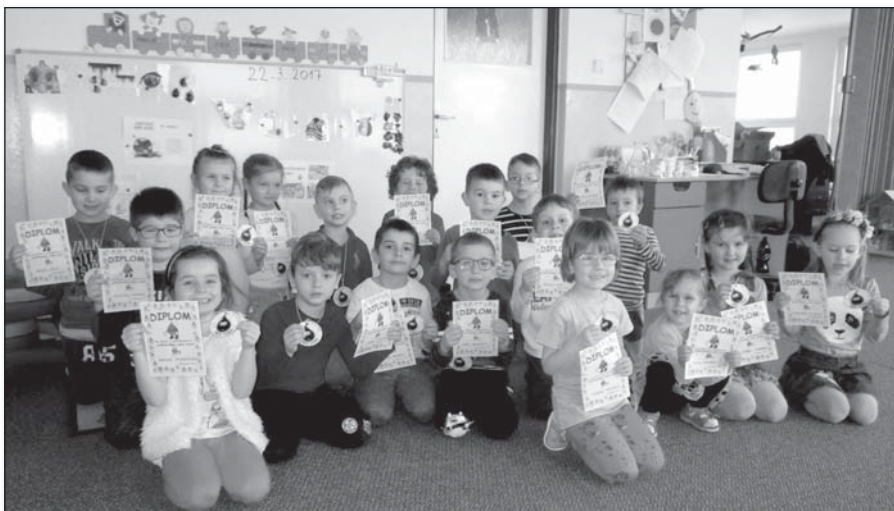
• Sovičky so zaslúženou odmenou na Svetový deň vody

Marec je už desiatky rokov známy prívlastkom Mesiac knihy. Knihy šíria osvetu a vzdelanosť a tu zastávajú neodmysliteľnú úlohu knižnice. Navštívili sme s deťmi miestnu knižnicu v dome kultúry, kde nám teta knihovníčka poukazovala knihy rôznych žánrov a deti mali možnosť listovať v tých, ktoré ich zaujali a učili sa správať, ako sa pri návšteve knižnice patrí. Je dôležité vstépevať lásku ku knihe už v predškolskom veku. V každej triede majú deti voľný prístup ku knihám v knižnici, v ktorej nájdu leporelá, obrázkové knihy, rozprávkové knihy, naučné encyklopédie, knihy o zvieratkách, básne či riekanky. Učíme deti siahat' po knihe, teda po múdrosti. „Ten, kto nemiluje knihu, nemiluje múdrosť. Ten, kto nemiluje múdrosť, stáva sa hlupákom,“ povedal raz dávno J. A. Komenský. Už druhým rokom funguje v našej MŠ projekt Kde bolo, tam bolo... – popoludňajšie celotýždňové čítanie rozprávok, ktorého