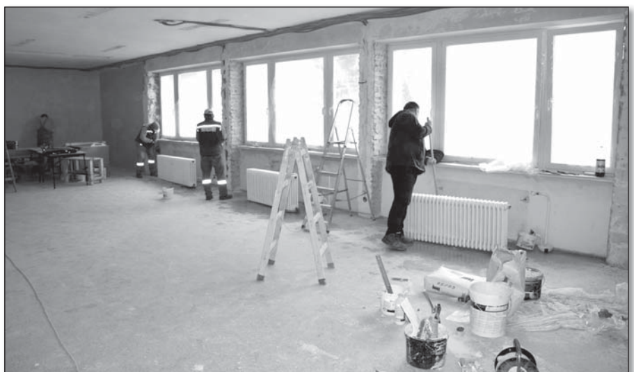
● Búracie práce vo veľkej zasadačke

Asi najviac problematickou stavebnou akciou bude výstavba chodníka na Družstevnej ulici. Mnohí občania si tento chodník žiadajú, no problém je predovšetkým v samotných občanoch. Chodník sa môže postaviť len v miestach, kde sú predzáhradky rodinných domov. Niektorí ľudia však nevedia pochopiť vyšší záujem a pozemky pod chodník nemajú záujem obci odpredať. Všetci vieme, že chodník sa vo vzduchu stavať nedá a stačí, ak časť pozemku neodpredá jeden vlastník, stavba sa pozastaví. Chodník musí byť postavený v línii a nesmie byť delený na zrealizované a nezrealizované časti. Pri geodetickom zameriavaní niektorí občania nejavili záujem s geodetmi komunikovať, navyše ich nevpustili na svoj pozemok vykonať potrebné zamerania. Chcel by