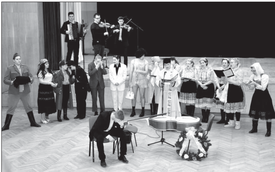
• Bolo že to smútku, keď sa s milovanou basou lúčil!

Nedeľňajšie popoludnie bolo ako stvorené na dobrú zábavu a posedenie. Už pri vstupe do domu kultúry sa mohli návštevníci ponúknuť chutnými šiškami, ktoré sú symbolom fašiangov. Aj vyzdobený interiér predpovedal, že fašiangy by mali byť veselé a zábavné.