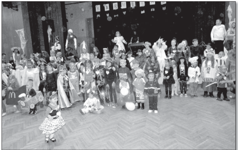
● Fašiangovali sme na karnevale

Návšteva MŠ predstavuje šancu a výzvu zároveň. Deti sa učia pohybovať v skupine, učia sa presadzovať svoje pránia a záujmy prijateľným spôsobom, byť samostatné a nezávislé a rastie ich sebadôvera a sebavedomie. Spoznávajú, čo to znamená nadväzovať priateľstvá a učia sa znášať sklamanie. Žijeme v spoločnosti, v ktorej sú aj malé deti vystavené dennému pôsobeniu a vplyvu počítačových hier, tabletov, televízie, filmov či farebných obrázkových časopisov, ktoré preferujú hrubú brutalitu a násilie, a deti sú voči týmto vplyvom často bezbranné. Život priniesol a vyprodukoval amerikanizované typy hračiek, hier a det-