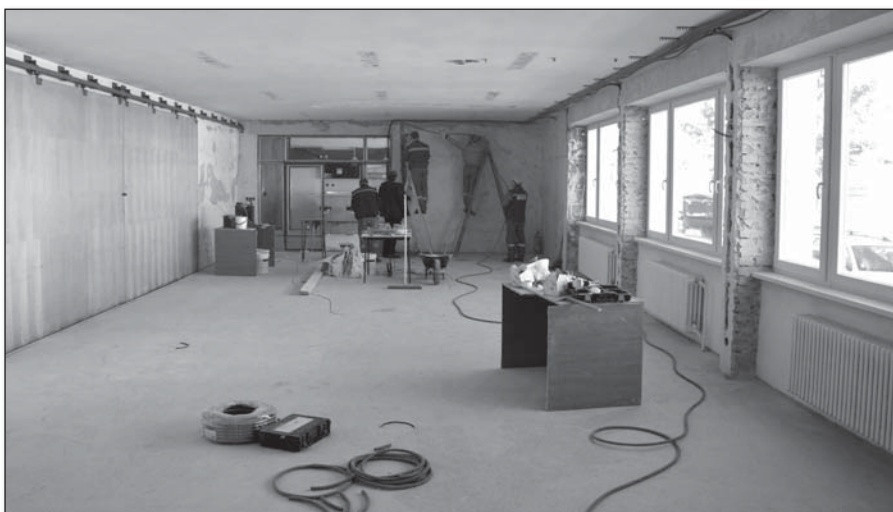
● Aj veľká zasadačka potrebovala rekonštrukciu

nosti zrekonštruovať aj zostávajúce priestory domu kultúry ako vestibul či sála.