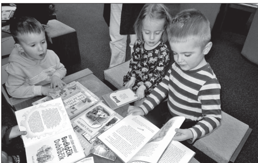
• Najmladší čitatelia z Lienok v knižnici