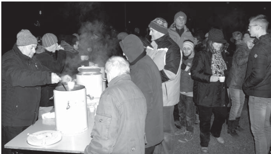
• Červené a biele varené víno podávali aj starosta so svojim zástupcom