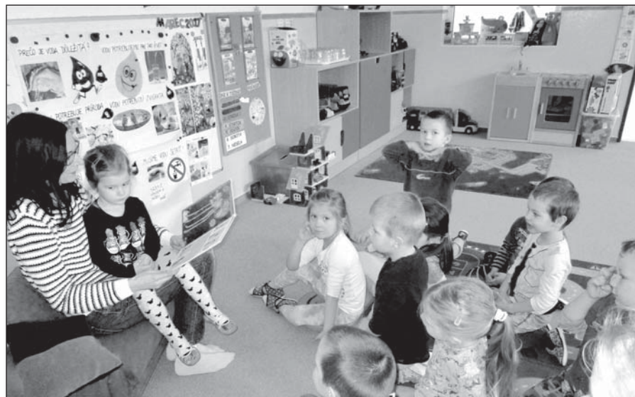
● Kde bolo, tam bolo... vo Veveričkách

učia deti prírodu milovať, spoznávať, vážiť si ju, šetriť, chrániť či zveľaďovať.