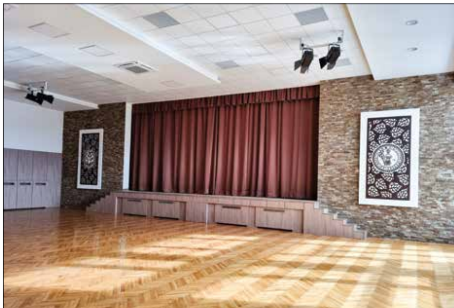
● Rekonštrukcia sály domu kultúry, roky 2020 – 2022