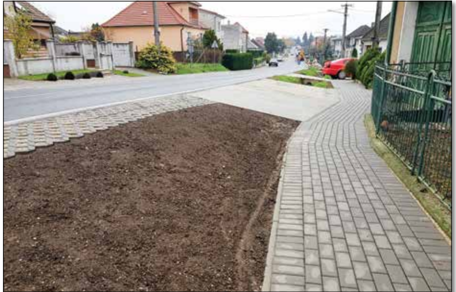
● Rekonštrukcia chodníka na Trnavskej ceste, rok 2019