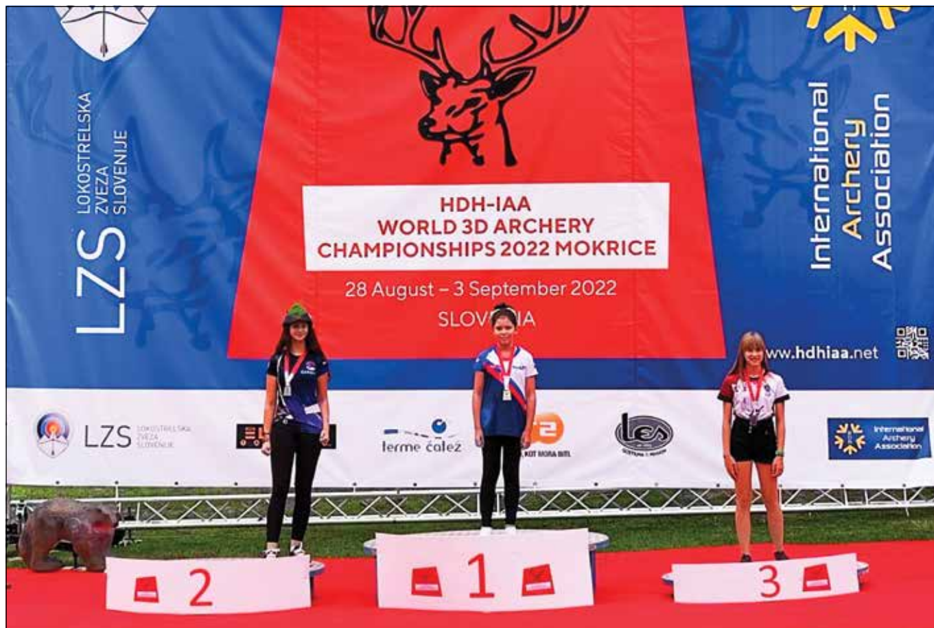
● Prvé miesto na súťaži v slovinskej Mokrici