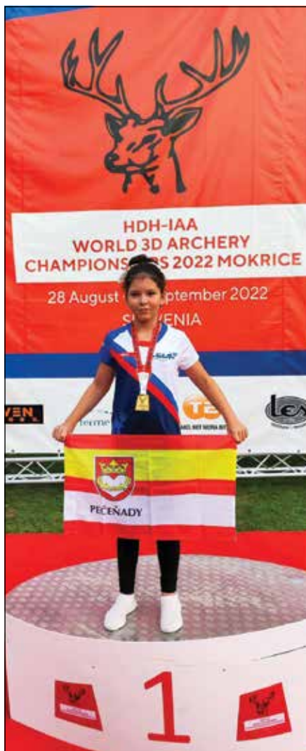
● Medaila pôjde do Pečeniad...