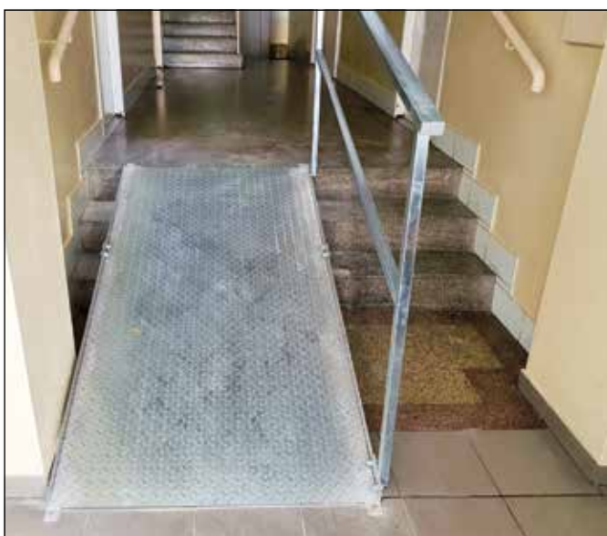
● Osadenie rampy v budove zdravotného strediska pre imobilných občanov, rok 2020