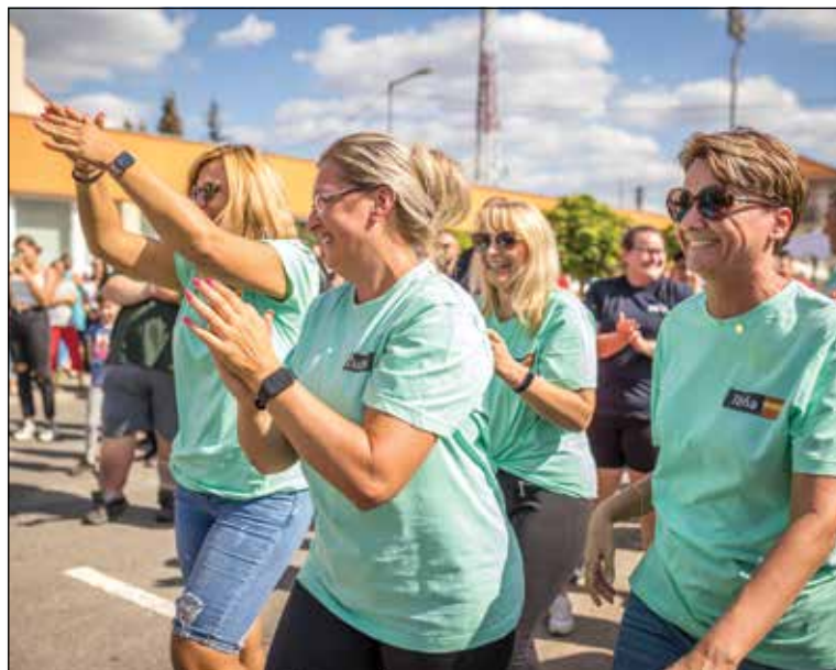
● Durancelky si idú po zlato