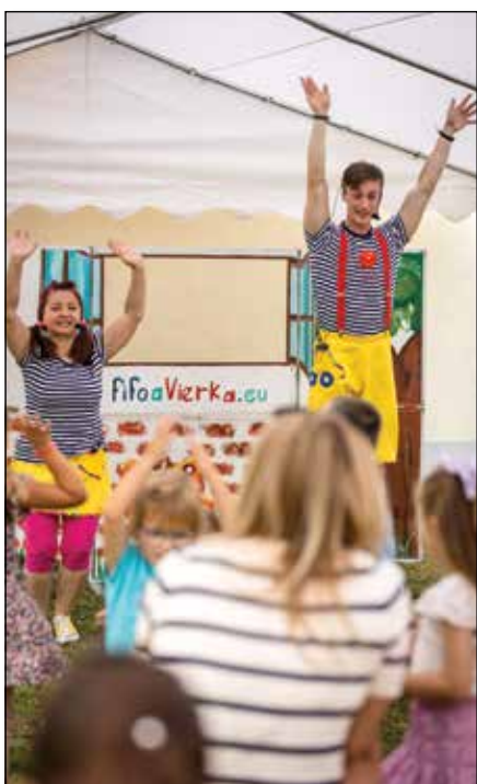
● Fífo a Vierka bavili tých najmenších