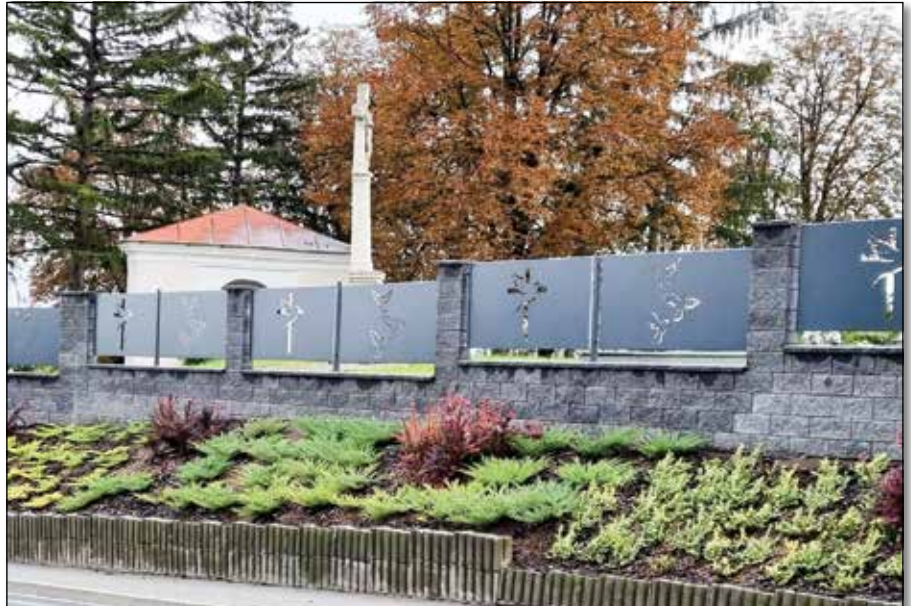
● Výstavba nového oplotenia cintorína a výsadba zelene, rok 2020