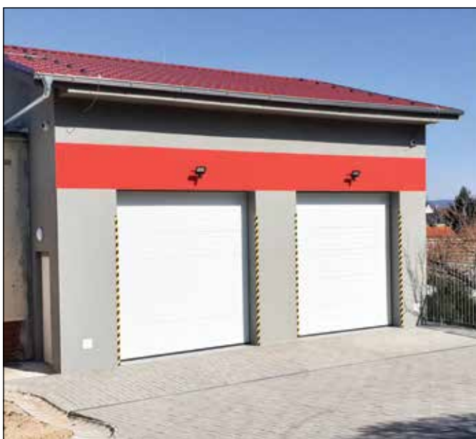
● Výstavba garáže k budove hasičskej zbrojnice, rok 2020