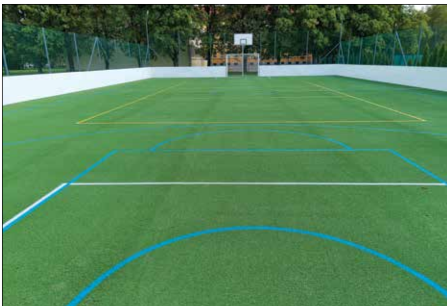
● Výstavba multifunkčného ihriska, rok 2022