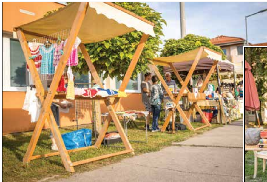
● Tradičné remeslá či inú kultúru predvedli miestni aj hostujúci remeselníci

Pozitívny pohľad na jarmok nám však zostal, nakoľko sprievodné akcie boli bohaté a našli si v nich svoj priestor mladší aj starší. Deťom sa venovali animátori, ktorí mali pre ne pripravené rôzne hry, atrakcie či divadlo. Obecný úrad zabezpečil pre každé dieťa napolitánky a lízanky, čo uvítali hlavne tí najmenší. No a starší sa venovali vareniu gulášu, či ochutnávaniu rôznych jedál v stánkoch s občerstvením.