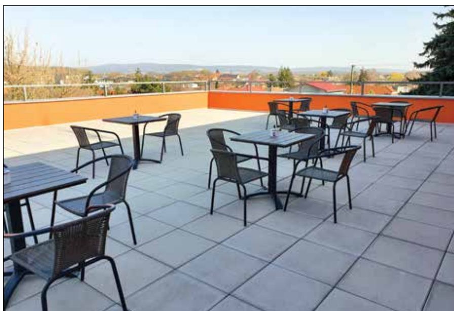
● Nová vonkajšia terasa pri dome kultúry, roky 2021 – 2022