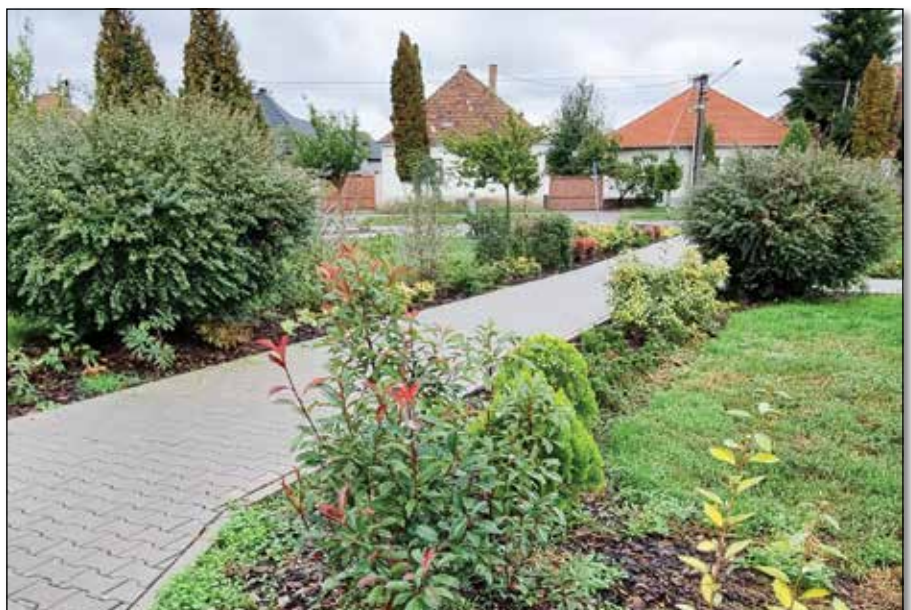
● Rekonštrukcia chodníka na Ulici Ľ. Štúra spojená s výsadbou zelene a drevín, rok 2020