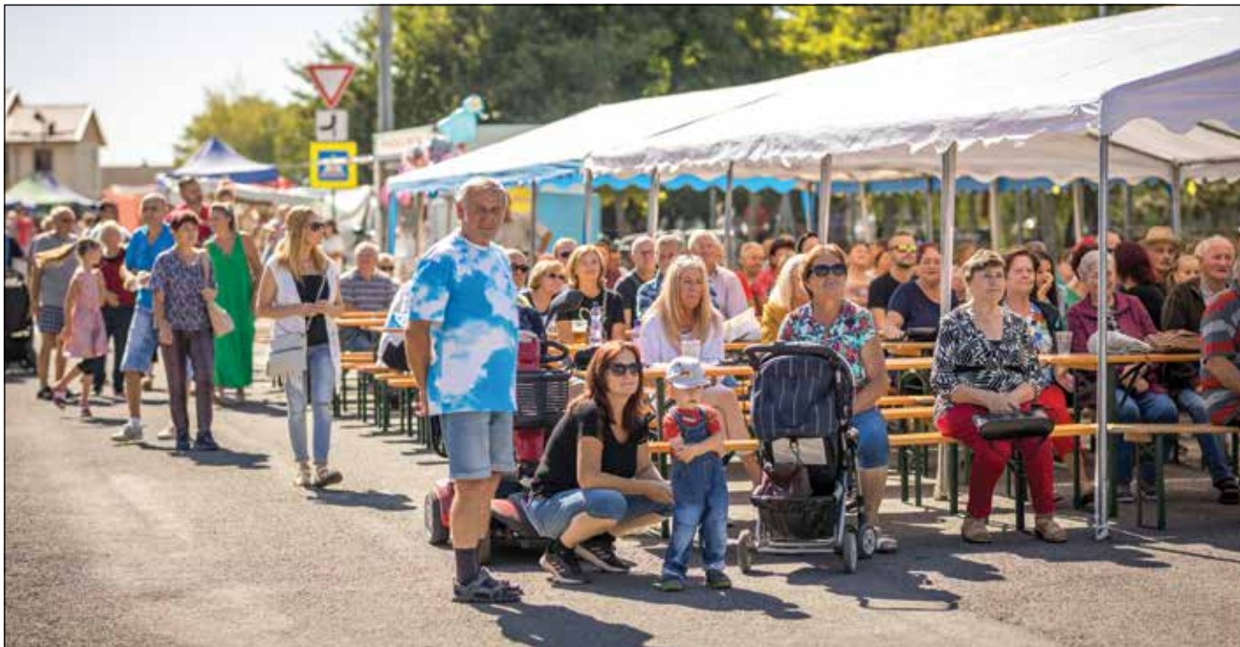
● Pohodová a príjemná atmosféra sa niesla počas celého jarmoku

Jedenásty ročník Kostolianskeho jarmoku sa skončil dve hodiny po polnoci a zhodnotiť ho môžeme iba kladne. A veríme, že v podobnom duchu sa bude konať aj v budúcom roku. Tešíme sa spoločne s Vami a už teraz Vás všetkých srdečne pozývame.