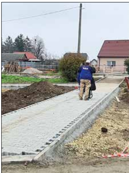
● Výstavba nového chodníka pred supermarketom