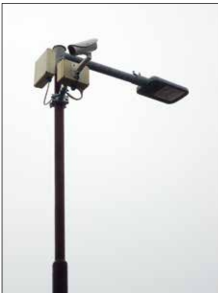
● Rozšírenie kamerového systému v obci, rok 2019