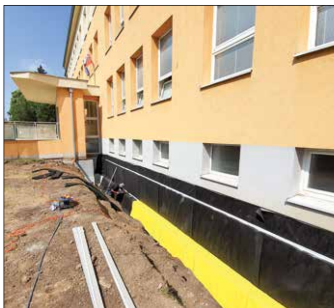
● Sanácia poškodených základov budovy základnej školy, rok 2021