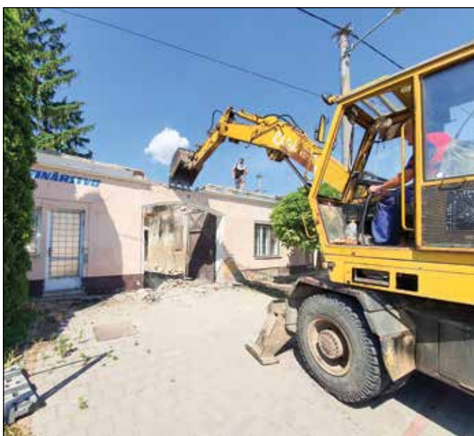
● Asanácia budovy bývalého MNV, rok 2020