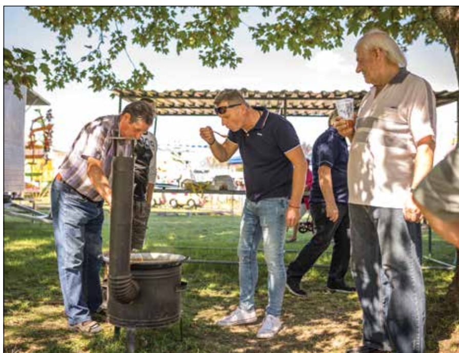
● Starosta obce ochutnal každý guláš, ale v porote nesmel byť...