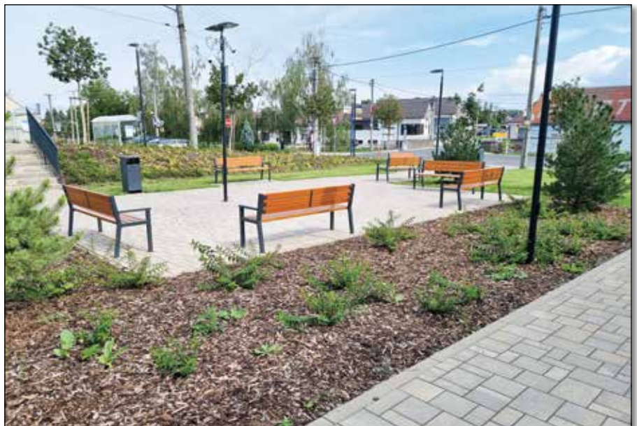
● Výstavba centrálnej oddychovej zóny na mieste bývalého MNV, roky 2021 – 2022