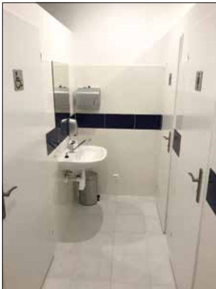
● Rekonštrukcia sociálnych zariadení v budove zdravotného strediska, rok 2019