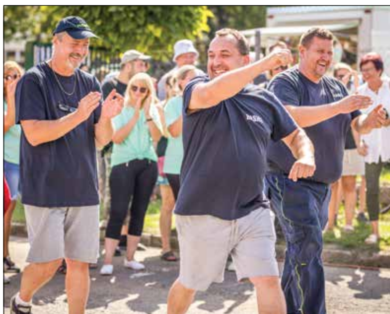
● Hasiči si vyvarili štvrté miesto