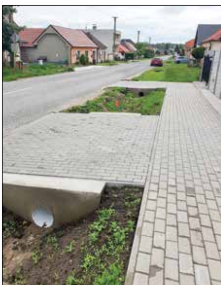
● Výstavba chodníka na pozemkoch, ktoré boli majiteľia ochotní odpredať obci na Družstevnej ulici, rok 2020