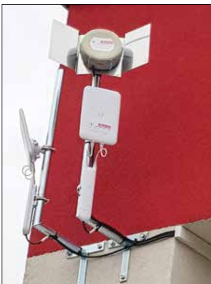
● WiFi zdarma v obci zriadili pre všetkých občanov, rok 2019