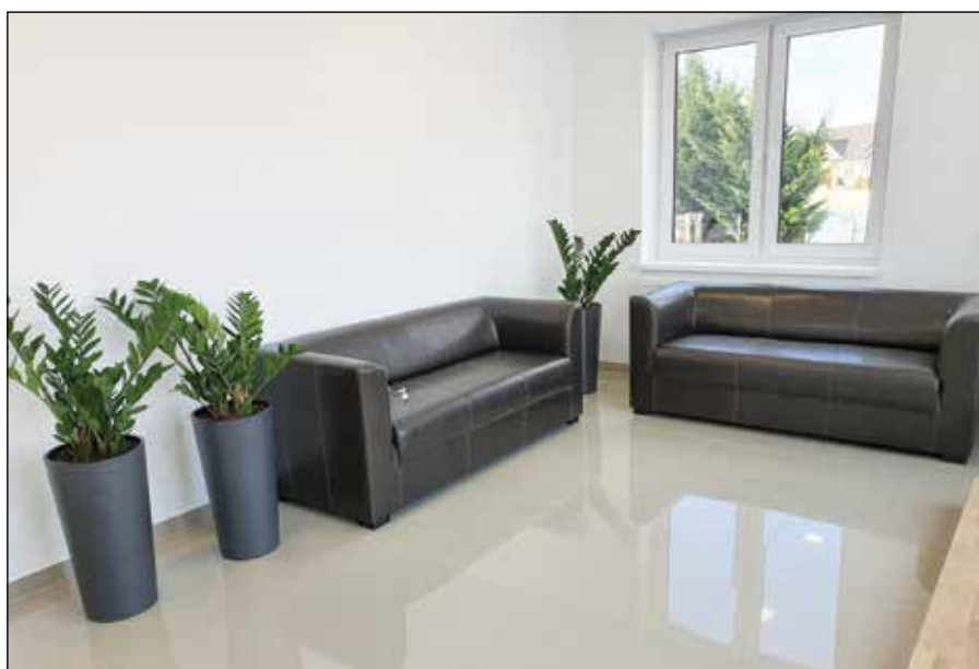
● Vytvorenie nových priestorov v dome kultúry, roky 2021 – 2022