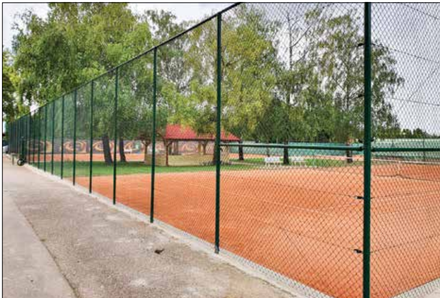
● Rekonštrukcia oplotenia tenisových kurtov v areáli ZŠ, rok 2020