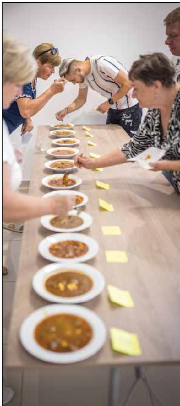
● Porota pri hodnotení najlepšieho gulášu