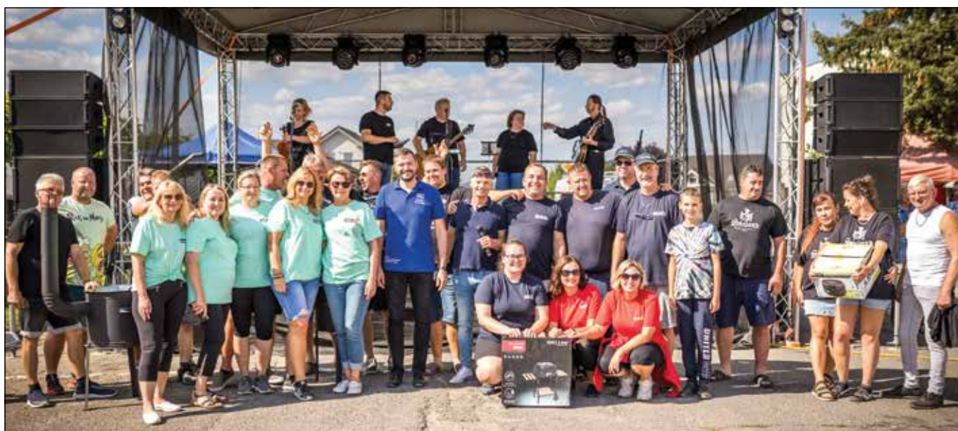
● Víťazné tímy vo varení gulášu