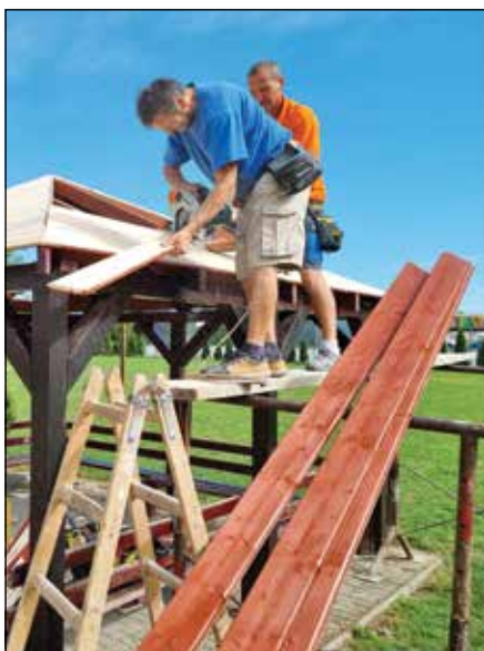
● Na detskom ihrisku boli obnovené zariadenia a strecha na prístrešku – rok 2022