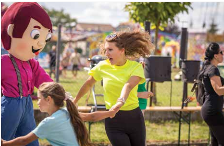
● Detskí animátori mali plné ruky práce