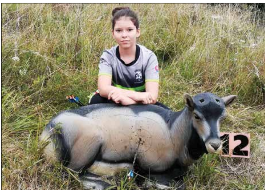
● Nelka na súťaži v prírode s maketou zvierat'a v životnej veľkosti

šípov (jeden alebo dva) a zapíšu do bodovacích tabuliek príslušné počty bodov. Celá súťaž trvá približne 3 – 4 hodiny, počas ktorých sa strelci pohybujú v prírode. Súťaže v 3D lukostrelbe usporadúvané členskými klubmi sa na Slovensku konajú v letnom období prakticky každý víkend, v zimnom sa časť súťaží koná v halách.