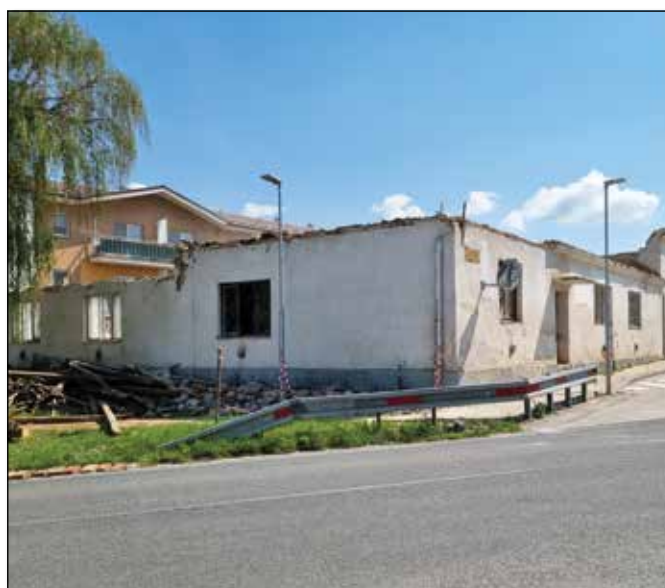
● Asanovali sme budovu bývalej starej školy a kultúrneho domu, rok 2022