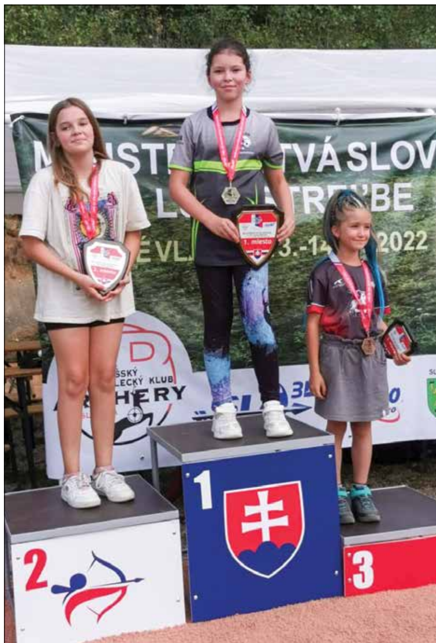
● Víťazka na domácich majstrovstvách Slovenska v auguste v Spišských Vlachoch