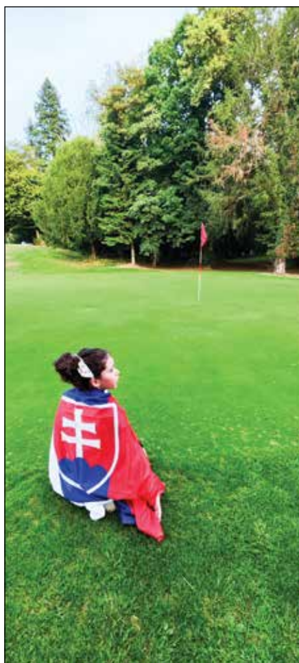
● Reprezentantka Slovenska v súťažnom teréne