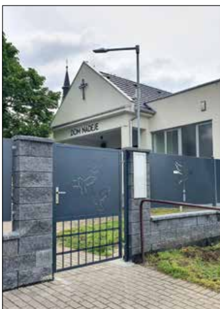
● Nové oplotenie areálu cintorína – rok 2021