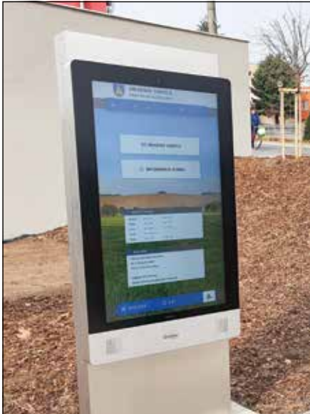
● Elektronickú úradnú tabuľu sme osadili v našej obci ako prví v okrese