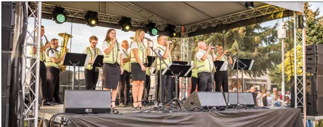
● Dychová hudba Rovina vždy pobaví melódiou aj hovoreným slovom