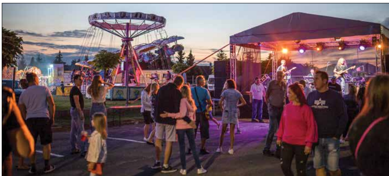
● Večerná skvelá nálada so skupinou Music Band Four a neskôr zábava s DJ Crazy