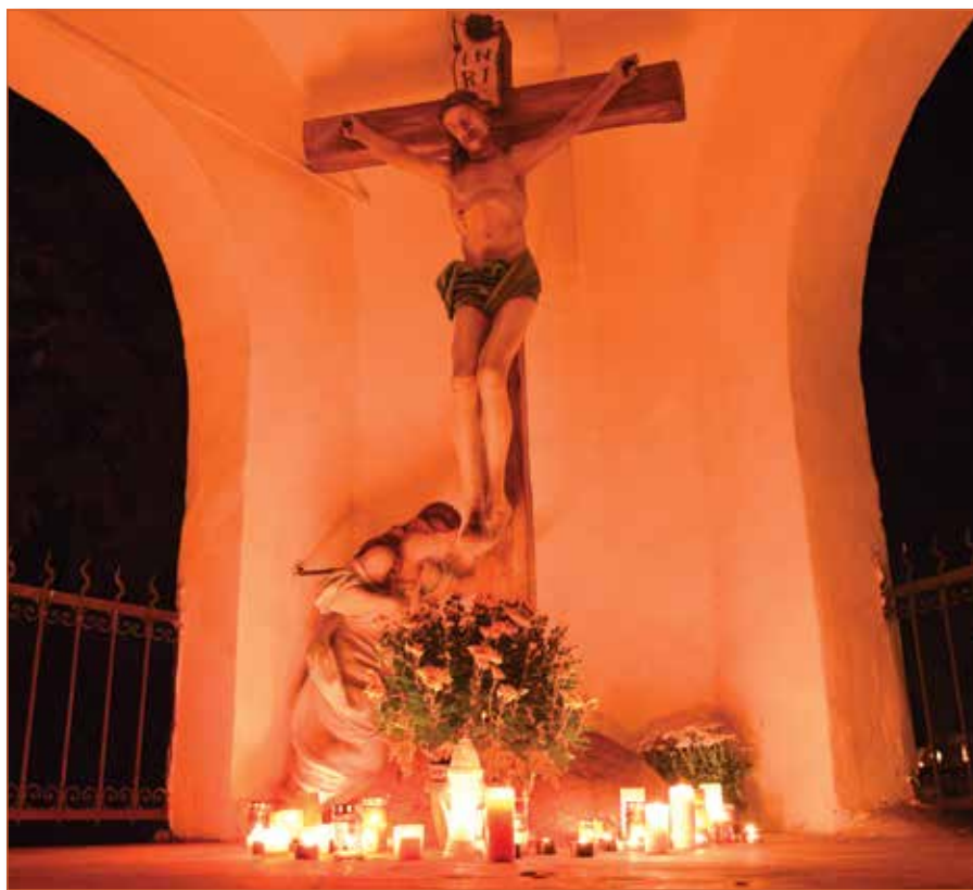
● Osvetlený cintorín má v týchto dňoch špecifickú atmosféru

Dušičky na našich cintorínoch sú ako svetielka odrážajúce sa do tmavej oblohy