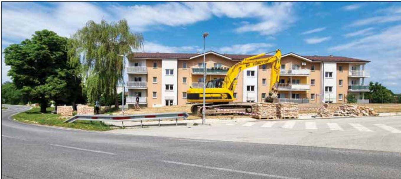
● Zrovnaná plocha po asanácii bývalého kultúrneho domu je pripravená na výstavbu parku so zeleňou a náučnými tabuľami, rok 2022