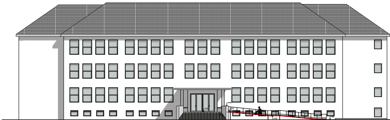
● Pohľad na umiestnenie budúcej rampy do budovy základnej školy pre imobilné osoby

zovať projektovú dokumentáciu a rozpočet, ktoré nám po viacerých urgenciách predložil v posledný májový deň. Na základe nových podkladov sme začali pripravovať proces verejného obstarávania, ktorý trval niekoľko mesiacov a ukončený bol v septembri. Vzhľadom na množstvo prijatých žiadostí o vysvetlenie od firiem, ktoré sa na obstarávaní zúčastnili, sme boli nútení neustále posúvať lehoty. Proces a lehoty sú stanové zákonom, ktoré musíme dodržať a nedokážeme to akokoľvek urýchliť. Výberové konanie na dodávateľa stavby bolo vyhlásené vo vestníku verejného obstarávania a prihlásilo sa doňho deväť stavebných spoločností.