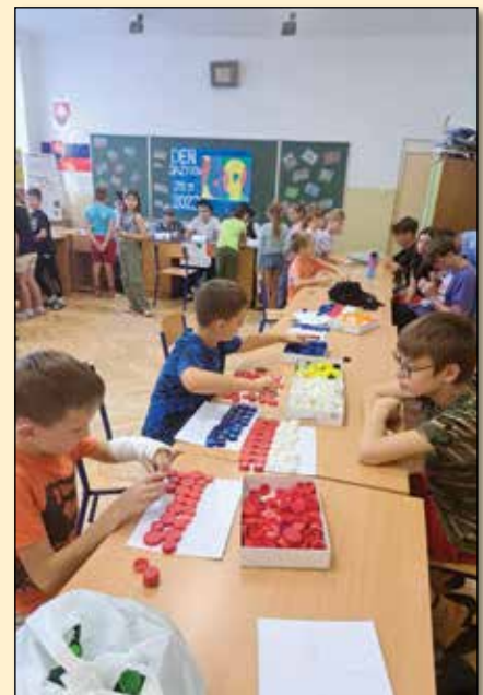
● Aktivity na stanovištiach

Minulosť seniorov bola často poznačená oveľa tvrdšou prácou a ťažším životom, preto by sme si ich mali vážiť a pomáhať im v súčasnosti, pre mnohých v komplikovanom svete.