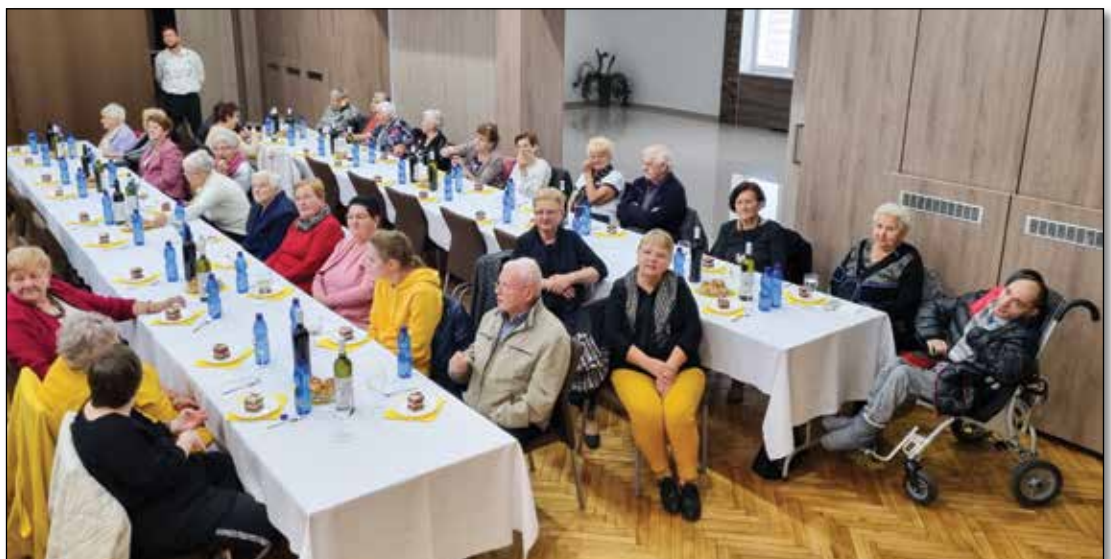
● Tóny hudby lahodili starším i mladším seniorom