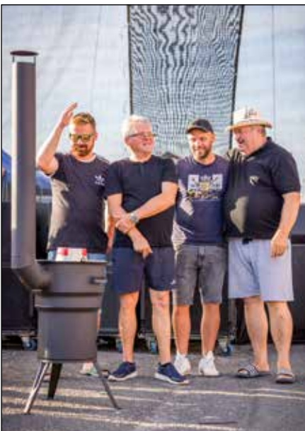
● Kuchári z Teamu obsadili druhú priečku