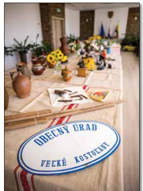
● Na výstave bolo čo pozerat'