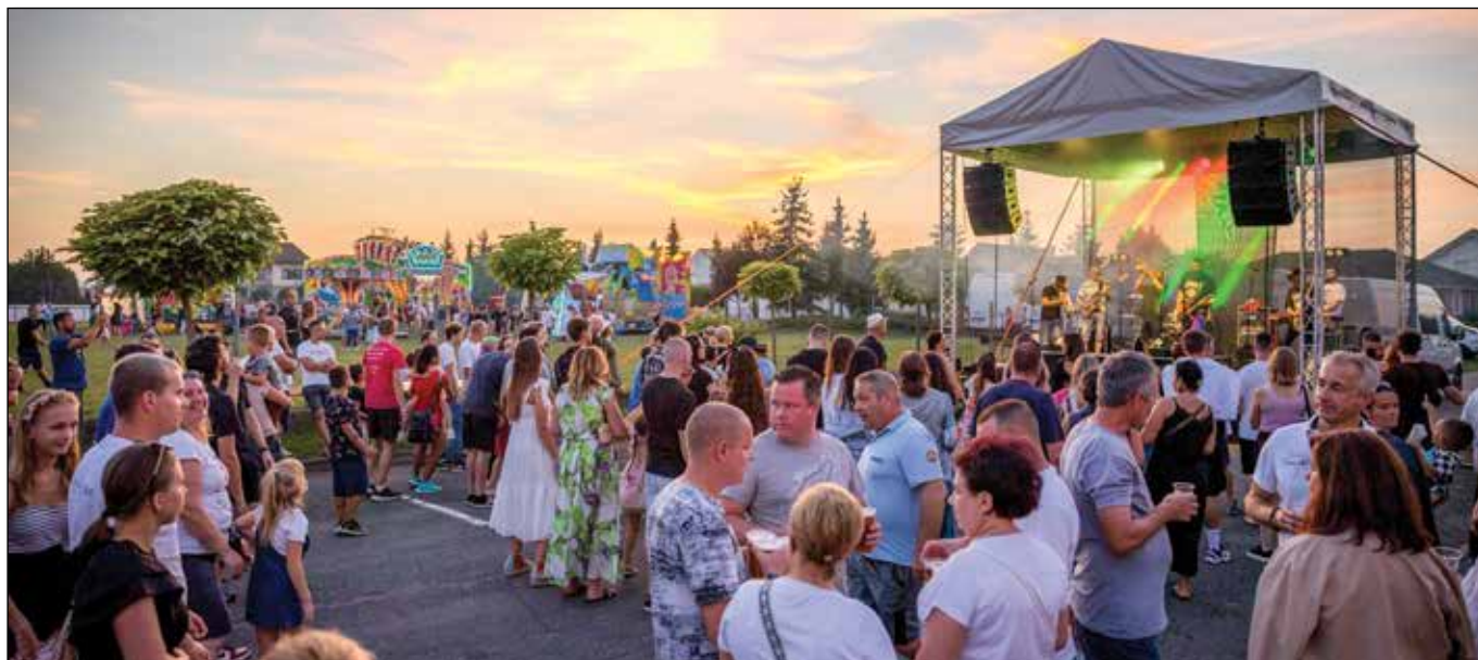
● Aj vo večerných hodinách jarmok pokračoval