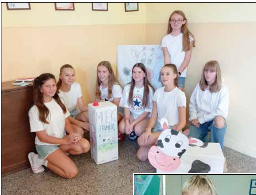
• Propagačné rekvizity ku Dňu mlieka a ich zhotoviteľky

Pre mladších spolužiakov si pripravili množstvo aktivít. Žiakom sprostredkovali hravou formou základné informácie o dôležitosti mlieka pre stavbu a správne fungovanie ich tela, spolu objavili nepoznané druhy mlieka. Zistili, aké látky mlieko obsahuje, zahrli sa na bás-