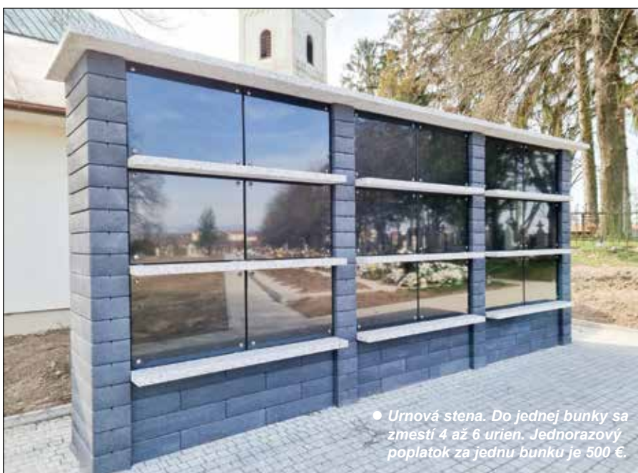
• Urnová stena. Do jednej bunky sa zmestí 4 až 6 urien. Jednorazový poplatok za jednu bunku je 500 €.

zidlá s vyššou výškou ako 3 metre. Za tento čas bola dvakrát poškodená, pričom posledné poškodenie bolo fatálne. V súčasnosti je osadené už nové zariadenie vybavené aj výstražnými svetlami a inak technicky riešené.