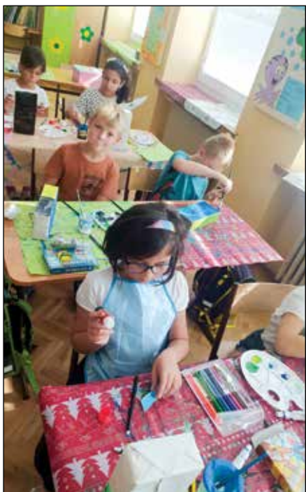
• Kreatívna tvorba – návrh na obal pre mlieko

V stredu 27.9.2023 si žiaci pripomenuli význam mlieka a mliečnych výrobkov v strave detí. Žiakom I. stupňa sa venovali naše šikovné žiačky z 8. B.