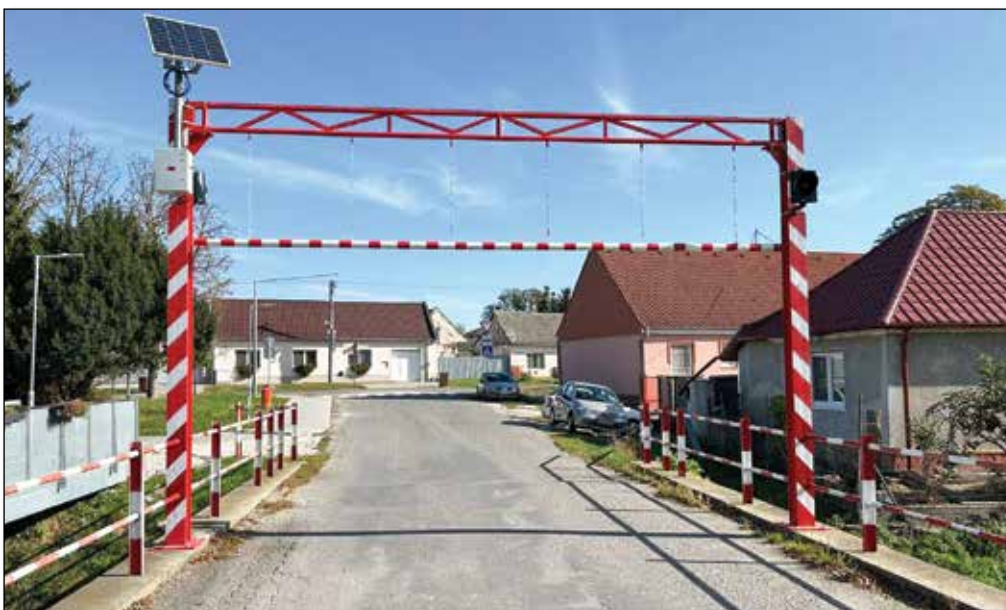
● Poškodenú rampu sme museli vymeniť za novú