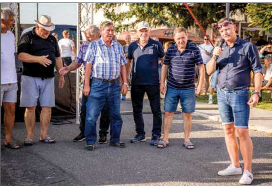
● Členovia klubu dôchodcov získali zlatú priečku vo varení gulášu