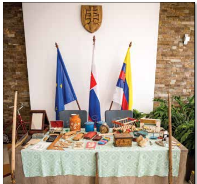
• Výstavu dobových predmetov zorganizoval klub dôchodcov