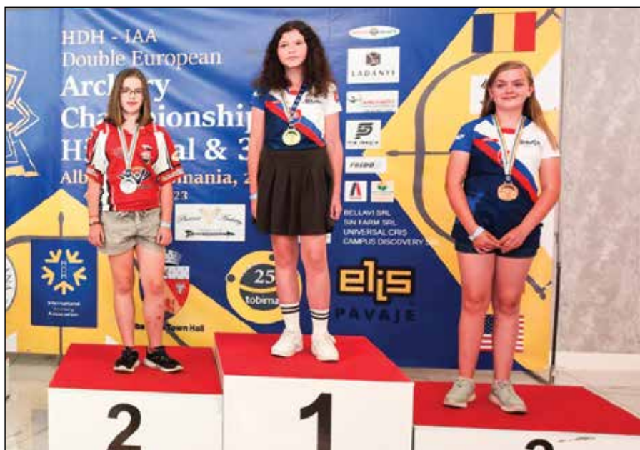
• Nelka na stupni víťazov