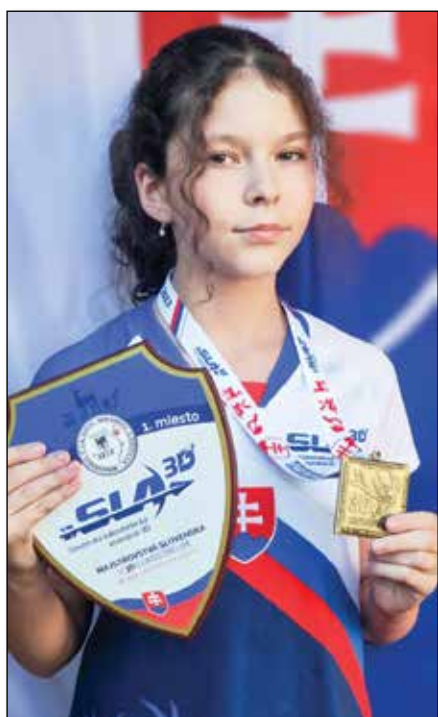
• Trofeje z majstrovstiev Slovenska

Vrcholným tohtoročným podujatím v športovej 3D lukostreľbe boli Majstrovstvá Európy HDH-IAA 2023, ktoré sa konali v termíne 8. – 13.8.2023 v Rumunsku, v historickom meste Alba Iulia.