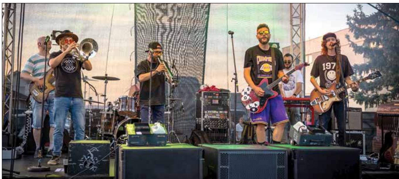
● Vystúpenie kapely Smola a hrušky si užila najviac mladá generácia