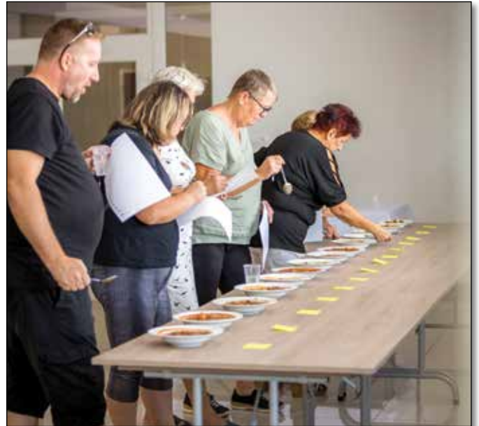
● Komisia zhodnotila všetky guláše