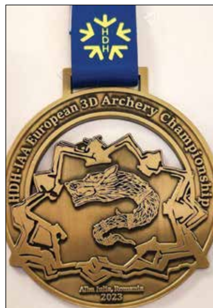
• Medaila z majstrovstiev Európy