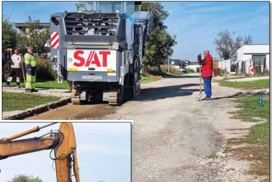
● Frézovanie povrchu dočasnej komunikácie na Záhumskej ulici

V marci po schválení žiadosti o stavebný úver na výstavbu cesty na Záhumskej ulici sme zadali projektantovi úlohu aktuali-