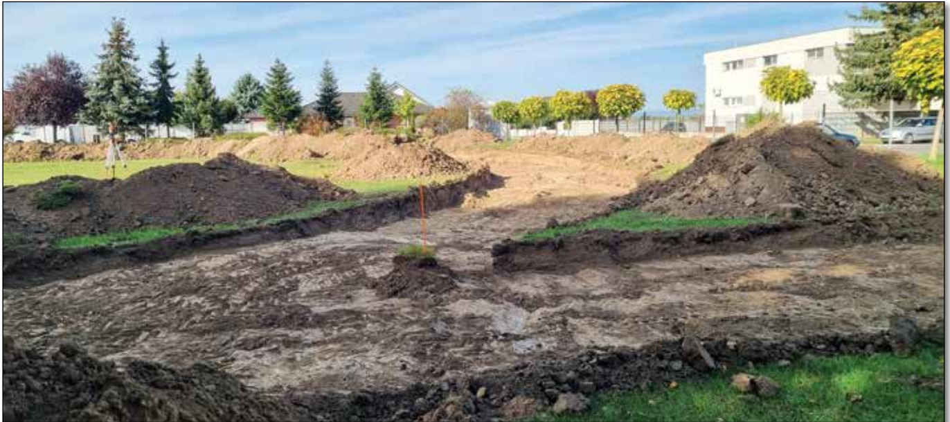
● Ovál atletickej dráhy bude merať 150 metrov

V auguste sa konalo prvé zasadnutie hodnotiacej komisie, ktorá bola zložená z poslancov obecného zastupiteľstva. Spoločnosť, ktorá ponúkla najnižšiu cenu, ale nevedela vysvetliť dôvod takto stanovenej ceny, musela byť podľa zákona o verejnom obstarávaní vylúčená. Po nej komisia kontrolovala podklady v poradí ďalšej spoločnosti. Tá však nepredložila požadované finančné referencie, a tak nasledovala v poradí ďalšia spoločnosť, s ktorou sme mohli podpísať zmluvu až na jedenásty deň od ukončenia verejného obstarávania, a to sme sa dostali už do mesiaca október. Rovnako ako občania Záhumenskej ulice, ani ja nie som spokojný s dátumom výstavby, avšak zákon nám prikazuje dodržiavať stanovené lehoty, ktoré nás s výstavbou značne zabrzdlili. Verím však aj vzhľadom na mierne počasie, ktoré v posledných rokoch panuje v našich oblastiach, že výstavba cesty sa napokon zrealizuje podľa časového harmonogramu.