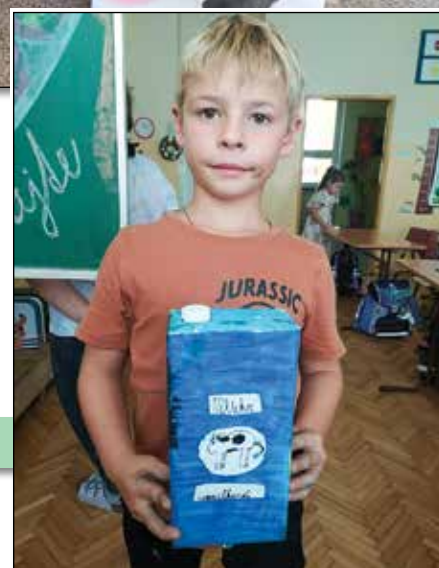
• Návrh na obal mlieka