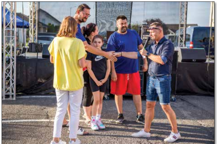
● Starosta zagrataloval gulášistom z Tomo Teamu k bronzovému umiestneniu