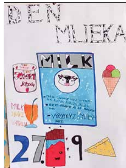
• Propagačný plagát