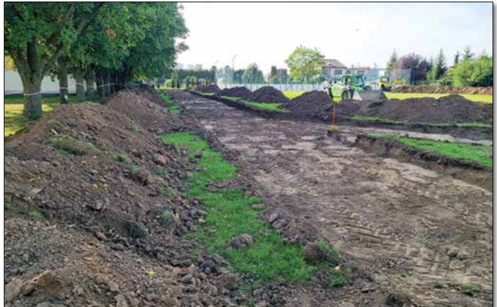
● Budúca atletická dráha bude mať doskočisko s rovinkou dlhou 73 metrov

V auguste sa konalo prvé zasadnutie hodnotiacej komisie, ktorá bola zložená z poslancov obecného zastupiteľstva. Spoločnosť, ktorá ponúkla najnižšiu cenu, ale nevedela vysvetliť dôvod takto stanovenej ceny, musela byť podľa zákona o verejnom obstarávaní vylúčená. Po nej komisia kontrolovala podklady v poradí ďalšej spoločnosti. Tá však nepredložila požadované finančné referencie, a tak nasledovala v poradí ďalšia spoločnosť, s ktorou sme mohli podpísať zmluvu až na jedenásty deň od ukončenia verejného obstarávania, a to sme sa dostali už do mesiaca október. Rovnako ako občania Záhumenskej ulice, ani ja nie som spokojný s dátumom výstavby, avšak zákon nám prikazuje dodržiavať stanovené lehoty, ktoré nás s výstavbou značne zabrzdlili. Verím však aj vzhľadom na mierne počasie, ktoré v posledných rokoch panuje v našich oblastiach, že výstavba cesty sa napokon zrealizuje podľa časového harmonogramu.