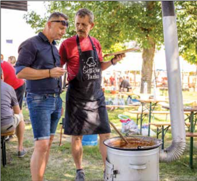
● Prvá ochutnávka gulášu