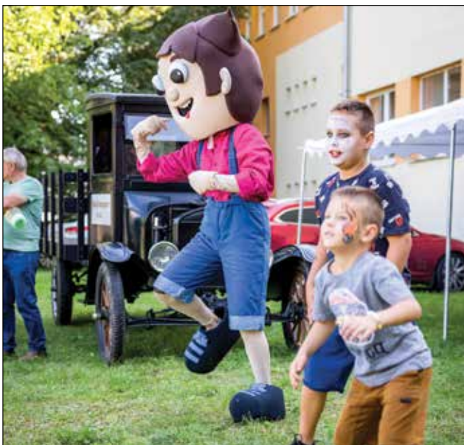
• Animátori si s deťmi aj zatancovali