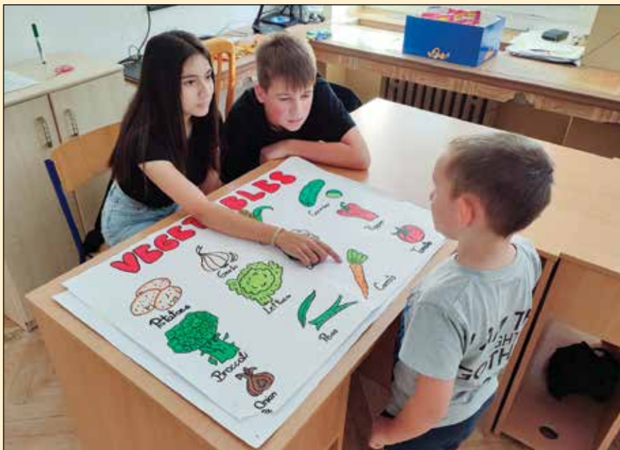
● Aj takto sa aktívne učí slovná zásoba