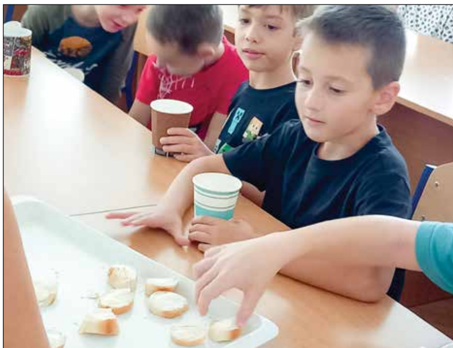
• Ochutnávka mliečnych výrobkov