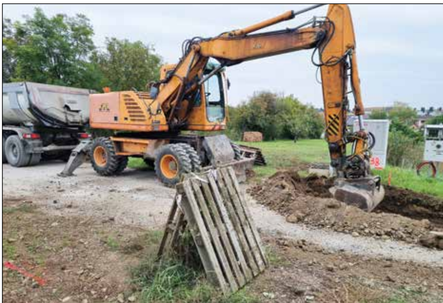
● Zemné práce na Záhumskej ulici pred položením podkladu pod budúcu asfaltovú komunikáciu

zovať projektovú dokumentáciu a rozpočet, ktoré nám po viacerých urgenciách predložil v posledný májový deň. Na základe nových podkladov sme začali pripravovať proces verejného obstarávania, ktorý trval niekoľko mesiacov a ukončený bol v septembri. Vzhľadom na množstvo prijatých žiadostí o vysvetlenie od firiem, ktoré sa na obstarávaní zúčastnili, sme boli nútení neustále posúvať lehoty. Proces a lehoty sú stanové zákonom, ktoré musíme dodržať a nedokážeme to akokoľvek urýchliť. Výberové konanie na dodávateľa stavby bolo vyhlásené vo vestníku verejného obstarávania a prihlásilo sa doňho deväť stavebných spoločností.